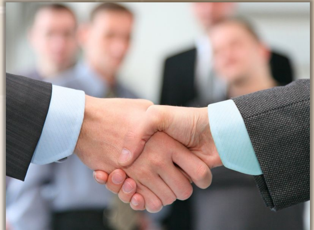
ОТНОСИТЕЛЬНЫЕ (ОГОВОРЕННЫЙ КРУГ ЛИЦ)