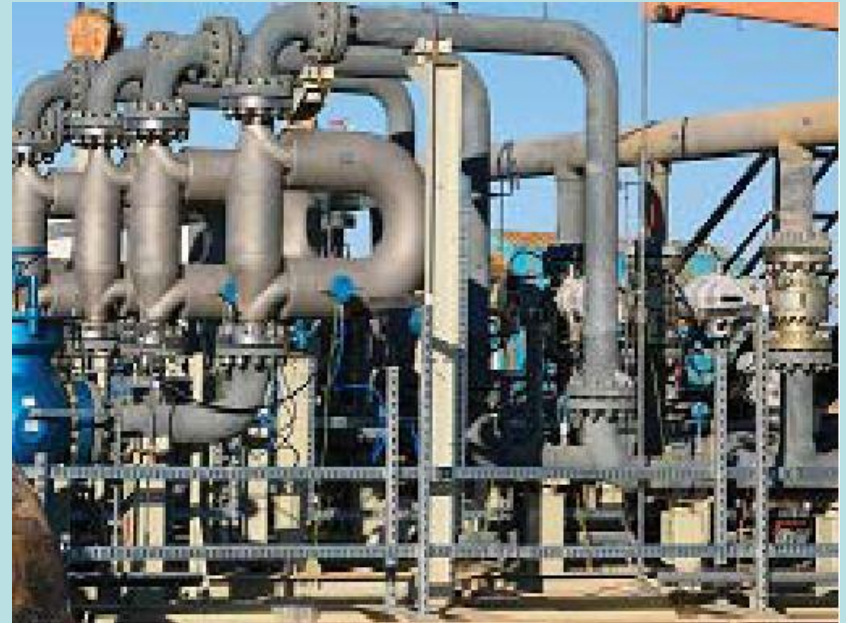
Узел коммерческого учета нефти