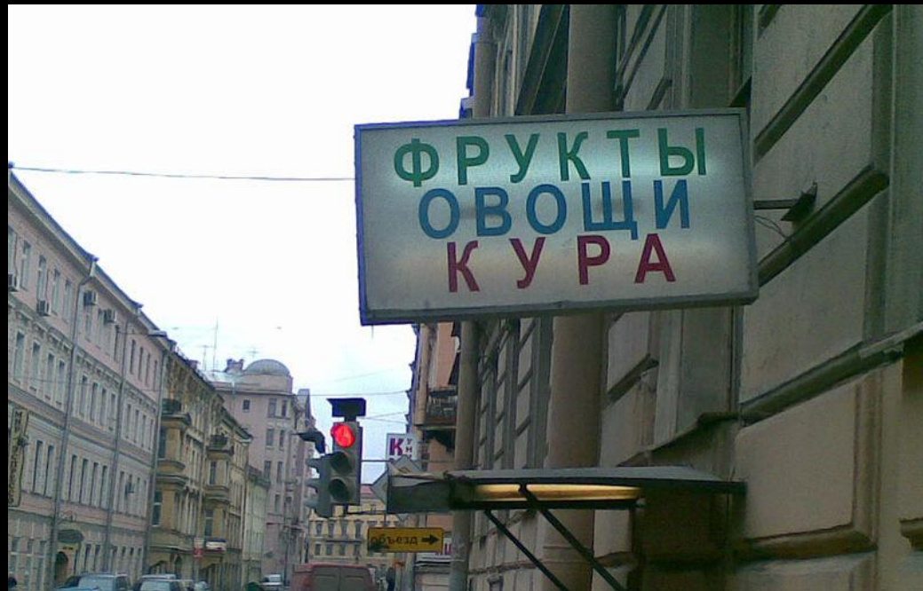
Уличная вывеска в Петербурге: «петербургская» кура