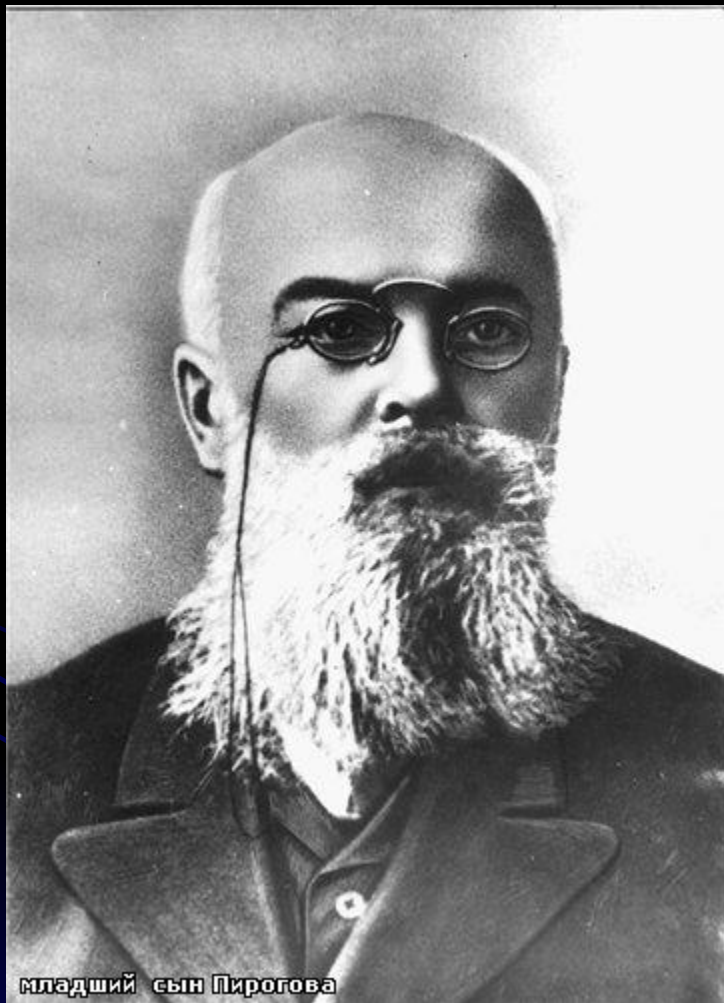
младший сын Пирогова