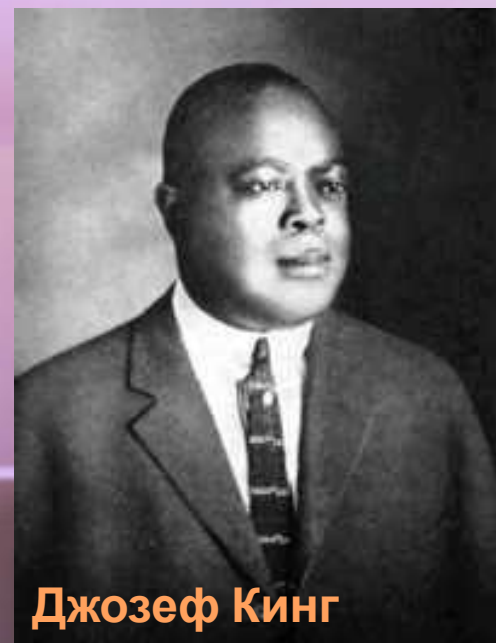
Джозеф Кинг Опивер