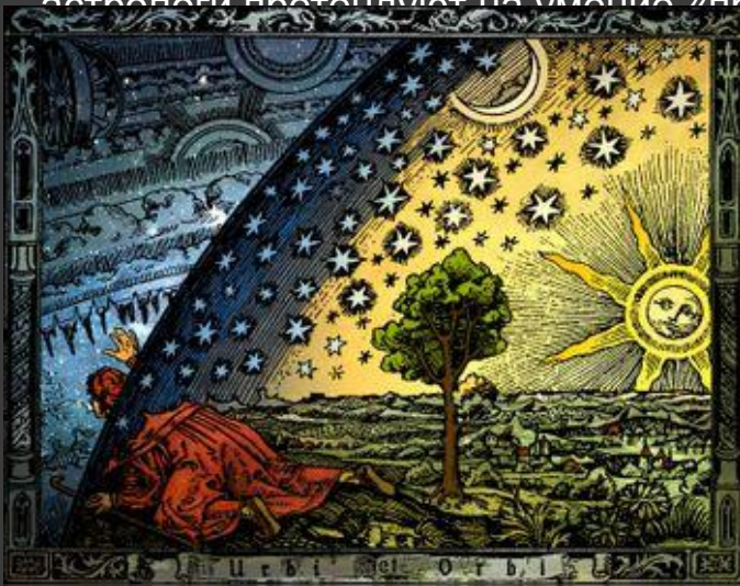
Вселенная. Гравюра на дереве. К. Фламарион (Париж, 1888). Раскраска Хайкенвальдер Хуго (Вена, 1998).