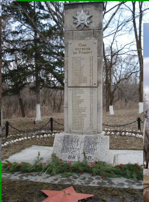
Стела «Памятник воинам-односельчанам, погибшим на фронтах Великой отечественной войны 1941-1945 гг.». с. Ширяевка.