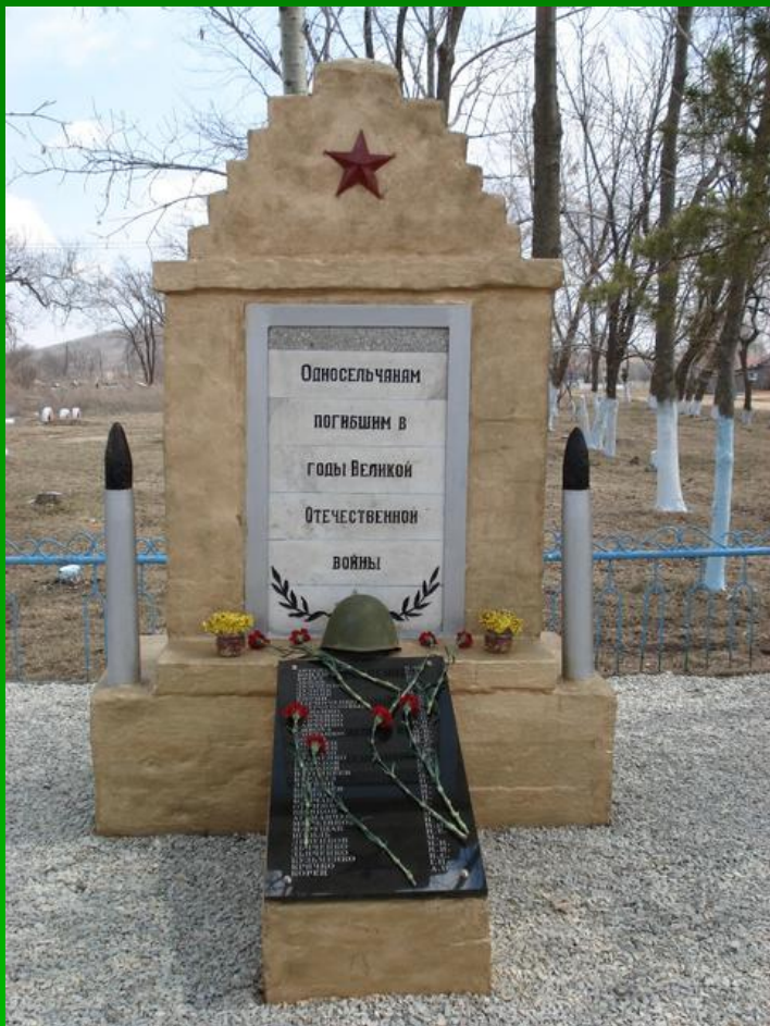
Стела: «Памятник воинам-односельчанам, погибшим на фронтах Великой отечественной войны 1941-1945 гг.». с. Новожатково