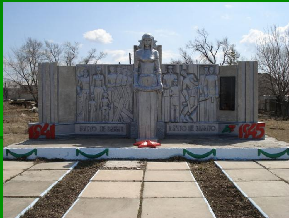
Монумент «Памятник воинам-односельчанам, погибшим на фронтах Великой отечественной войны 1941-1945 гг.». с. Абрамовка