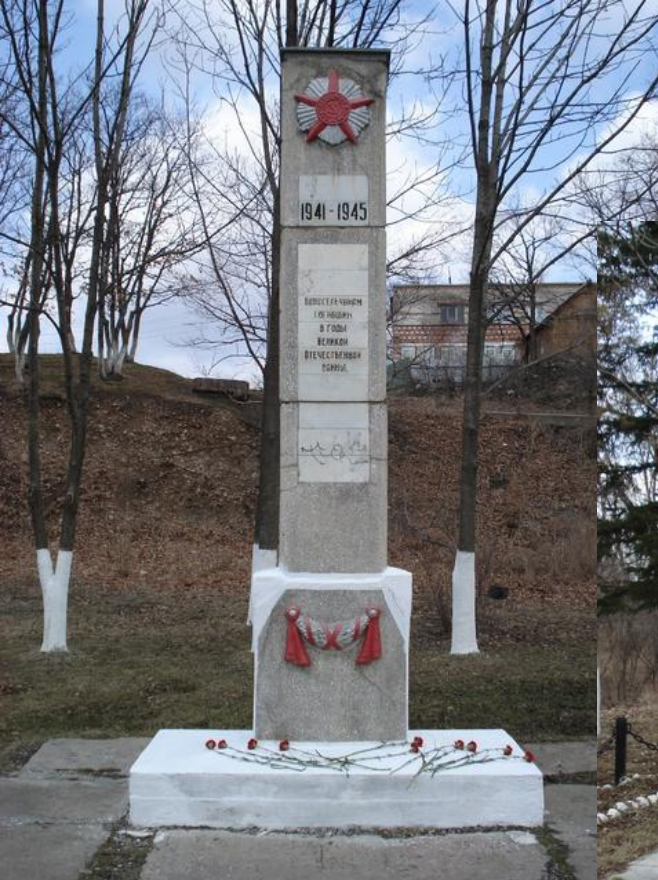
Стела «Памятник воинам-односельчанам, погибшим на фронтах Великой отечественной войны 1941-1945 гг.». с. Горное.