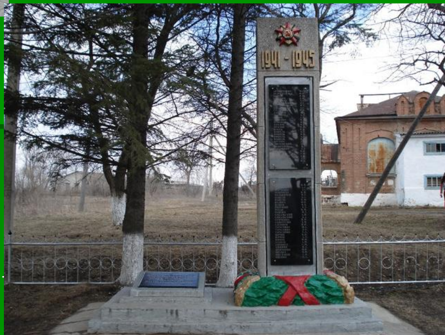
Стела «Воинам -односельчанам, погибшим в годы Великой Отечественной войны 1941-1945гг.». с. Григорьевка,