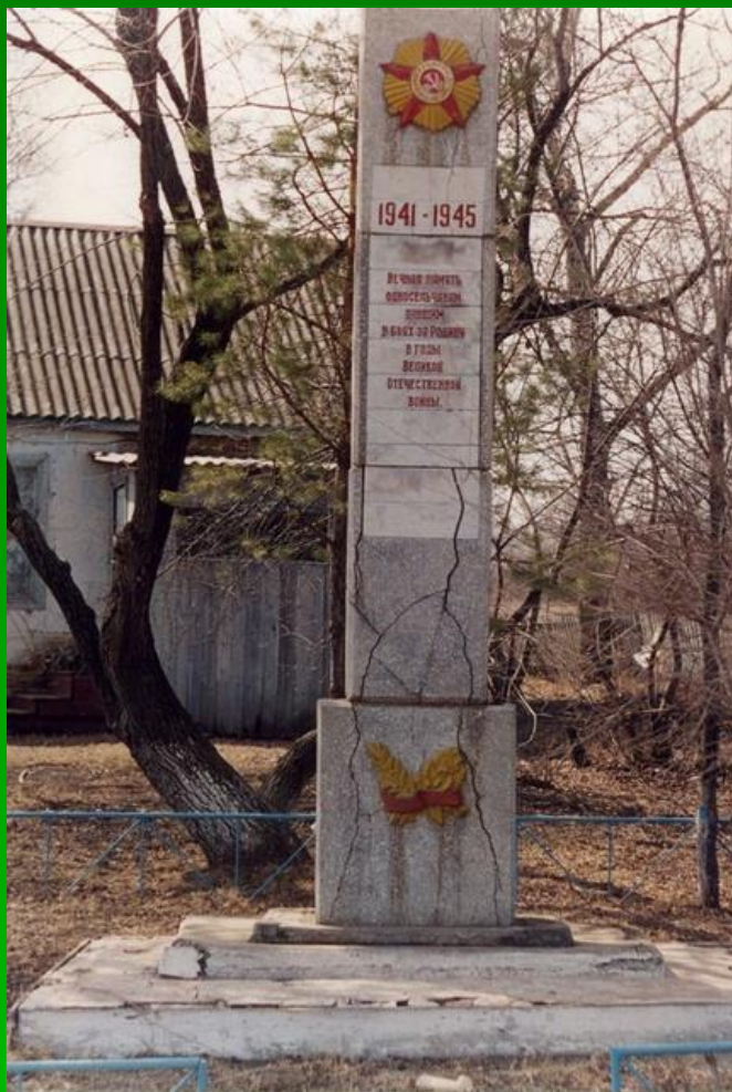
Стела «Памятник воинам-односельчанам, погибшим на фронтах Великой отечественной войны 1941-1945 гг.». с. Горбатка.