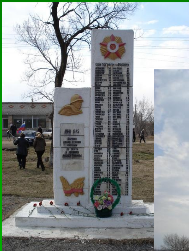
Стела «Памятник воинам-односельчанам, погибшим на фронтах Великой отечественной войны 1941-1945 гг.». с. Кремово.