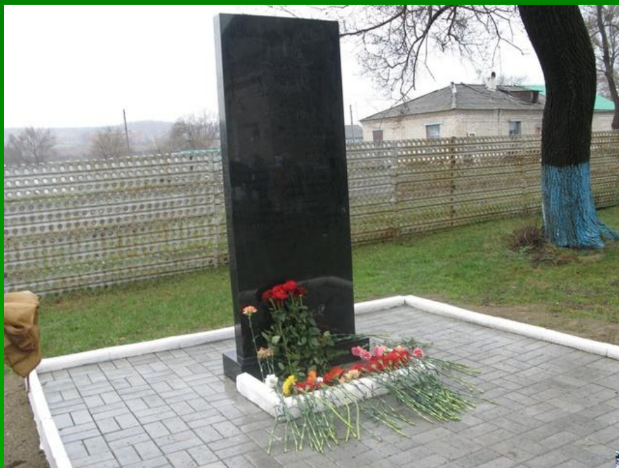
Обелиск «Воинам-односельчанам, погибшим на фронтах Великой отечественной войны 1941-1945г.г.». с. Васильевка