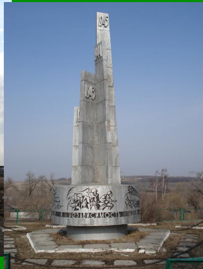
Стела «Памятник воинам-односельчанам, погибшим на фронтах Великой отечественной войны 1941-1945 гг.». с. Ляличи.