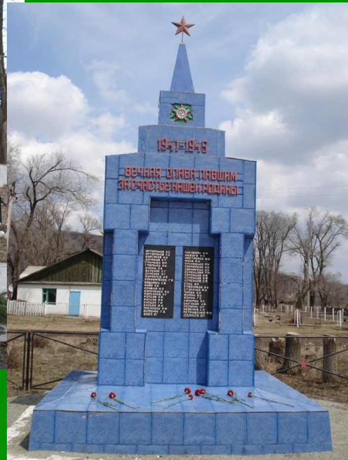
Обелиск «Памятник воинам-односельчанам, погибшим на фронтах Великой отечественной войны 1941-1945 гг.». с. Николаевка.