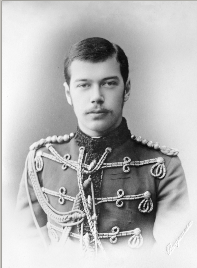
Николай Александрович, 1889 год

Николай Александрович Романов родился (6) 18 мая 1868 года в Царском селе. Он был старшим сыном императора Александра III и императрицы Марии Федоровны. По традиции Николай получил домашнее образование, соответствующее курсу гимназии. С ранних лет Николай испытывал тягу к военному делу. Сразу же после рождения он был зачислен в списки нескольких гвардейских полков и назначен шефом 65-го пехотного московского полка. В декабре 1875 получил свое первое воинское звание — прапорщика, а в 1880 был произведен в подпоручики, через 4 года стал поручиком. В 1884 Николай II поступил на действительную военную службу, в июле 1887 приступил к регулярной военной службе в Преображенском полку и был произведен в штабс-капитаны, в 1891 Николай получил звание капитана, а через год — полковника.