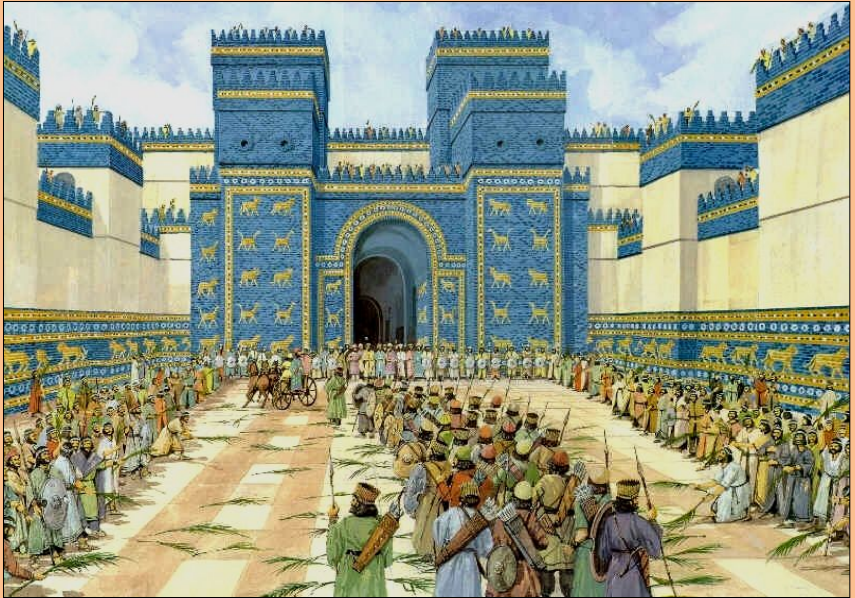
Ворота Богини Иштар