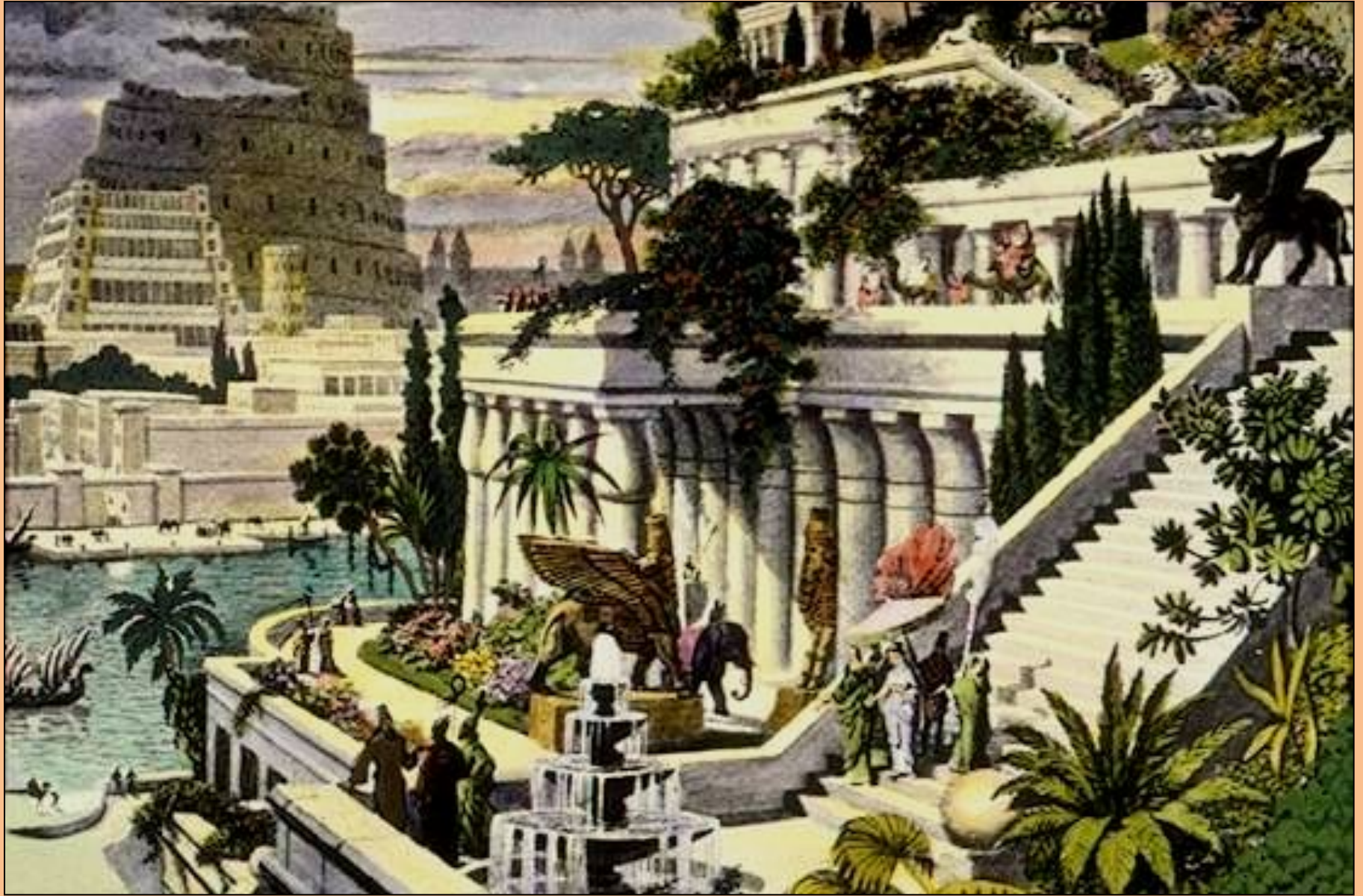
Висячие сады царицы Семирамиды, жены царя Навуходоносора