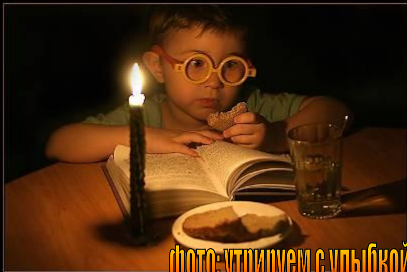
фото: утрируем с улыбкой!