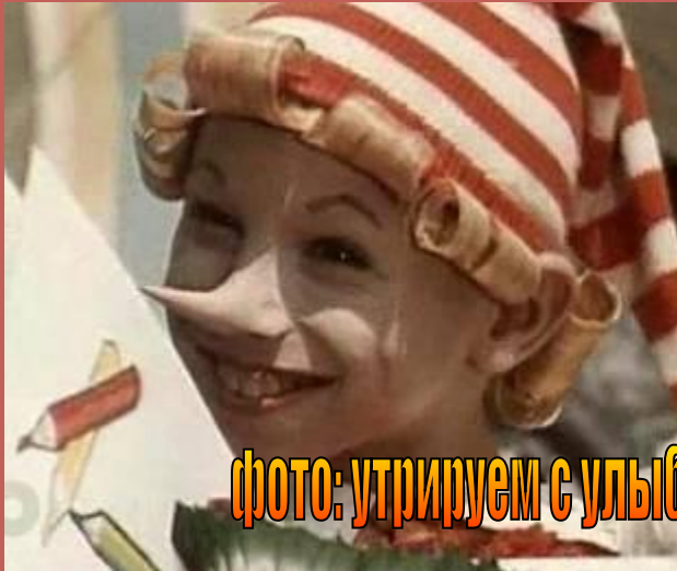
фото: утрируем с улыбкой!