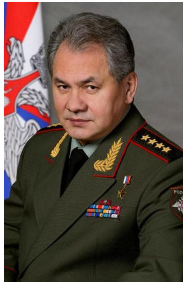
Шойгу Сергей Кужугетович Министр обороны Российской Федерации, генерал армии

Непосредственное руководство ВС РФ осуществляет Министр обороны РФ через Министерство обороны. Министерство обороны реализует политику в области строительства ВС РФ в соответствии с решениями высших органов государственной власти Российской Федерации.