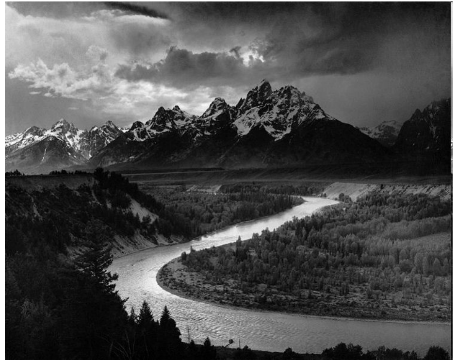
Фотография Энсела Адамса Хребет «Большой Титон» и река Снейк

Форма бытия искусства - художественное произведение, имеющее видовую и жанровую определенность и осуществляющееся в качестве материального предмета знака, который передает людям определенную художественную концепцию, обладающую эстетической ценностью