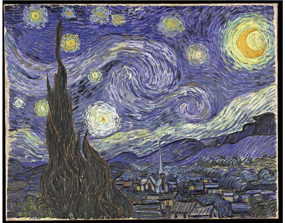
Винсент Ван Гог Звёздная ночь, 1889 г.

Жизнь людей отражается в искусстве во всем многообразии в форме художественных образов , которые, будучи результатом вымысла, тем не менее являются отражением действительности и всегда несут на себе отпечаток реально существующих предметов, событий и явлений