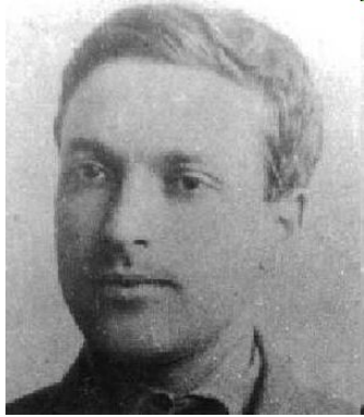
Л. С. Выготский (1832—1920 гг.)

определял возраст как относительно замкнутый период развития, имеющий собственное содержание и динамику. С его точки зрения, хронологический возраст и психологический возраст — два разных, несовпадающих понятия.