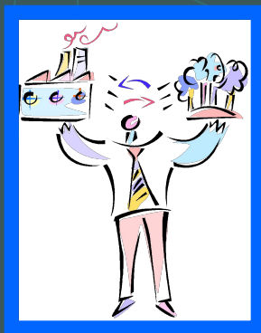
Ответственность перед обществом и людьми