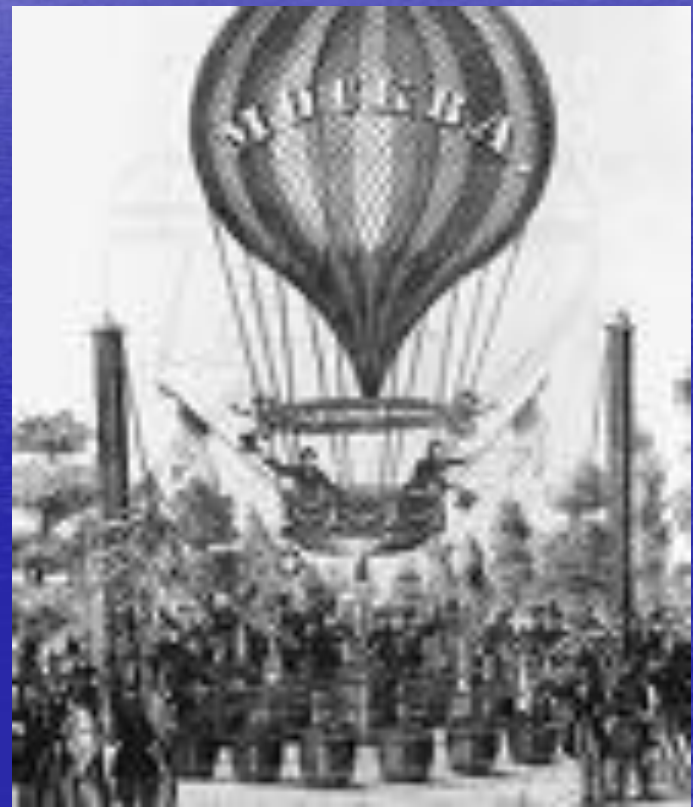
Один из братьев Монгольфье