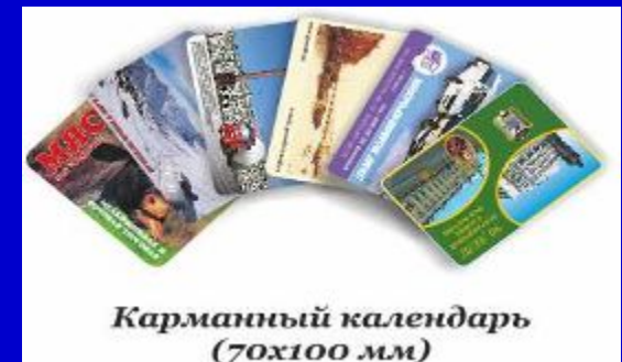
Карманный календарь (70x100 мм)