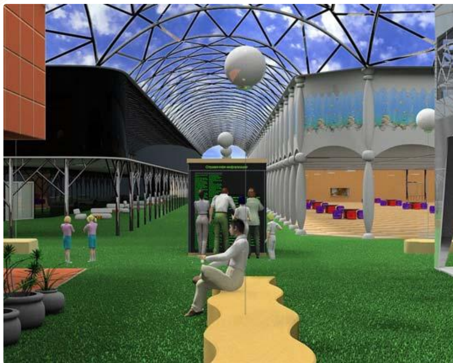
Внутренний дворик .

Главная особенность школы будущего – это полная компьютеризация. Даже расписание будет интерактивным ,причем ученик сам составляет его из набора обязательных предметов и предметов по выбору. Также ученик сам выбирает количество и длительность перерывов между уроками.