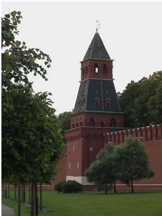
Благовещенская башня Московского Кремля

Благовещенская башня. По легенде в этой башне раньше хранилась чудотворная икона «Благовещение», а также в 1731г. к этой башне пристроили церковь Благовещения. Скорее всего, название башни связано с одним из этих фактов. В 17в. для прохода прачек к Москве-реке возле башни были сделаны ворота, названные Портомойными. В 1831г. их заложили, а в советское время разобрали и церковь Благовещения. Высота Благовещенской башни с флюгером 32,45 м.