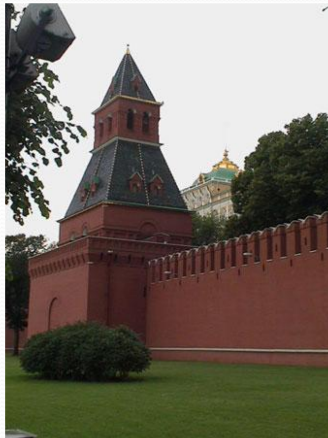
Тайницкая башня Московского Кремля

Первой башней, которая была заложена при строительстве Кремля, была Тайницкая. Тайницкая башня названа так потому, что от неё к реке вёл тайный подземный ход. Предназначался он для того, чтобы можно было брать воду в случае если крепость осадят враги. Высота Тайницкой башни 38,4 м.