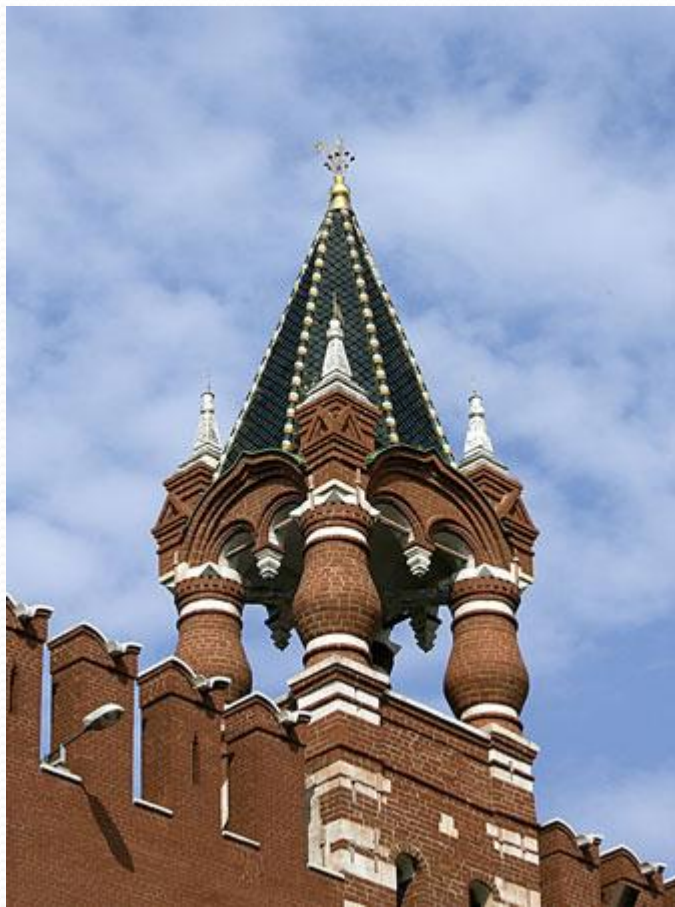
Царская башня Московского Кремля

Справа от Набатной башни находится Царская башня . Она совсем не похожа на другие Кремлёвские башни. Прямо на стене стоят 4 колонны, а на них островерхая крыша. Нет ни мощных стен, ни узких бойниц. Но они ей и ни к чему. Потому что строили башню вовсе не для обороны. По преданию царь Иван Грозный любил с этого места смотреть на свой город. Позже здесь соорудили самую маленькую башню Кремля и назвали её Царской. Высота её 16,7 м.