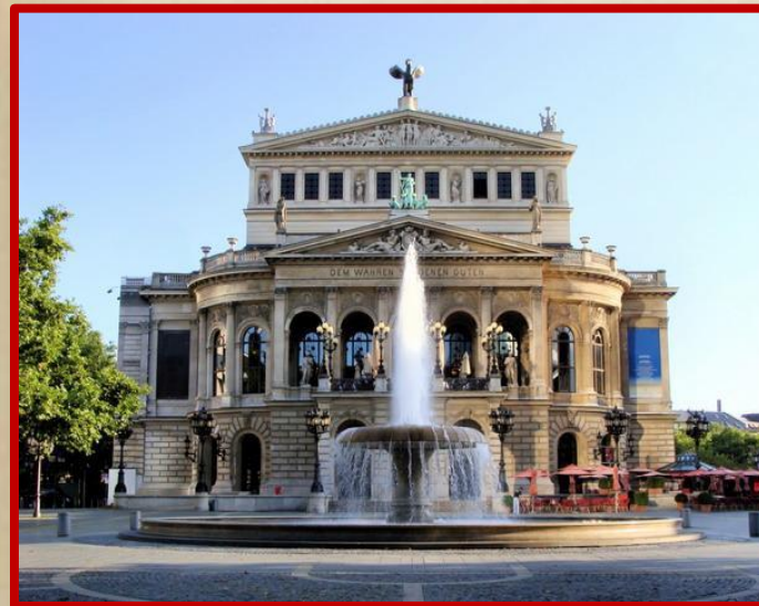
Старинное здание оперы