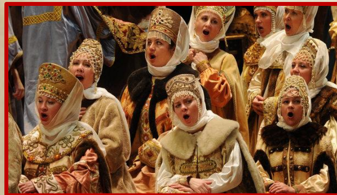
Опера «Борис Годунов»