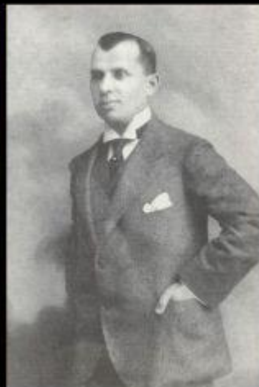
Леонид Александрович Сенько-Поповский, Черноморский вице- губернатор, основатель музея.

Музей в Новороссийске был создан в 1916 году по инициативе Черноморского вице-губернатора Л.А. Сенько-Поповского, как Музей Природы и Истории Черно-морского Побережья Кавказа. В основу его фондов легли предметы старины, хранившиеся в городской публичной библиотеке с 1894 г. и коллекции по палеонтологии и геологии первого хранителя музея Г.Н. Сорохтина.