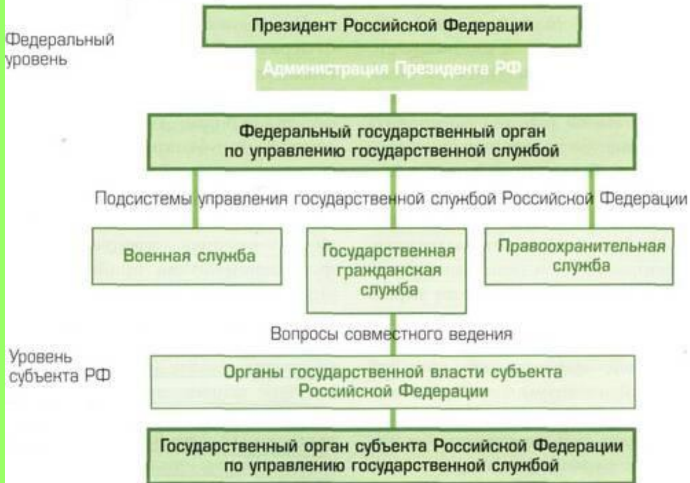
Рисунок 1. Структура управления государственной службой Российской Федерации (де-юре).