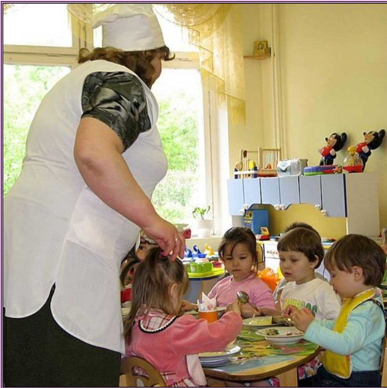
Повара работают в детских садах...