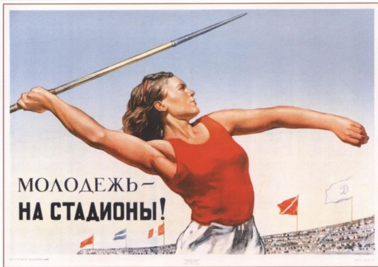
504. Голованов Л. Молодежь — на стадионы! 1947

С 2010 года программа начала свое возрождение.