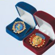
FU125a (бордо) FU125b (синий) Внут. размер: 45х42 мм

ПОДЛОЖКА В УПАКОВКЕ ДЛЯ ЗНАКОВ «ГОТОВ К ТРУДУ И ОБОРОНЕ»