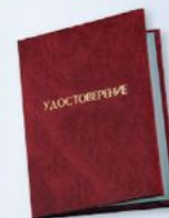
UD4 Размер: 110х80 мм Бумвинил, плотная бумага

ФУТЛЯРЫ ДЛЯ ЗНАКОВ «ГОТОВ К ТРУДУ И ОБОРОНЕ»