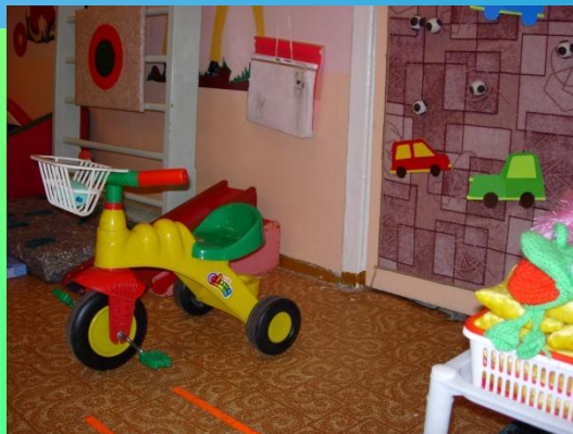
Группы раннего возраста