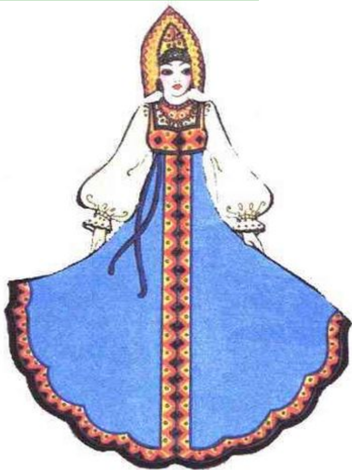
СЕВЕРОРУССКИЙ ЖЕНСКИЙ КОСТЮМ (САРАФАН)