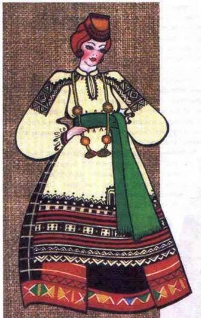
ЮЖНОРУССКИЙ ЖЕНСКИЙ КОСТЮМ (ПОНЕВА)

А в южных районах России модницы одевали поневный комплекс. Понева – юбка. Она одевалась непременно поверх рубахи, затем шел передник, а затем наверхник. Передник щедро украшался вышивкой