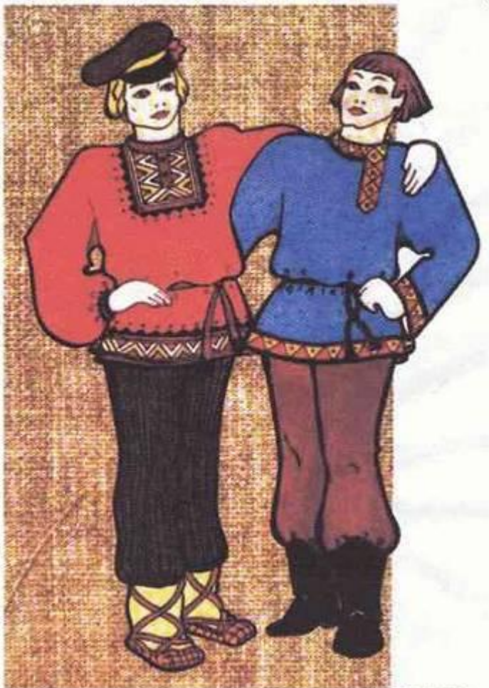
МУЖСКОЙ КРЕСТЬЯНСКИЙ КОСТЮМ (РУБАХА И ПОРТЫ)

Основой мужского костюма была рубаха. Она доходила до колен и подвязывалась поясом. Шили её из белой, синей, красной ткани. Частью костюма были штаны (порты). Они заправлялись в сапоги или обёртывались онучами.