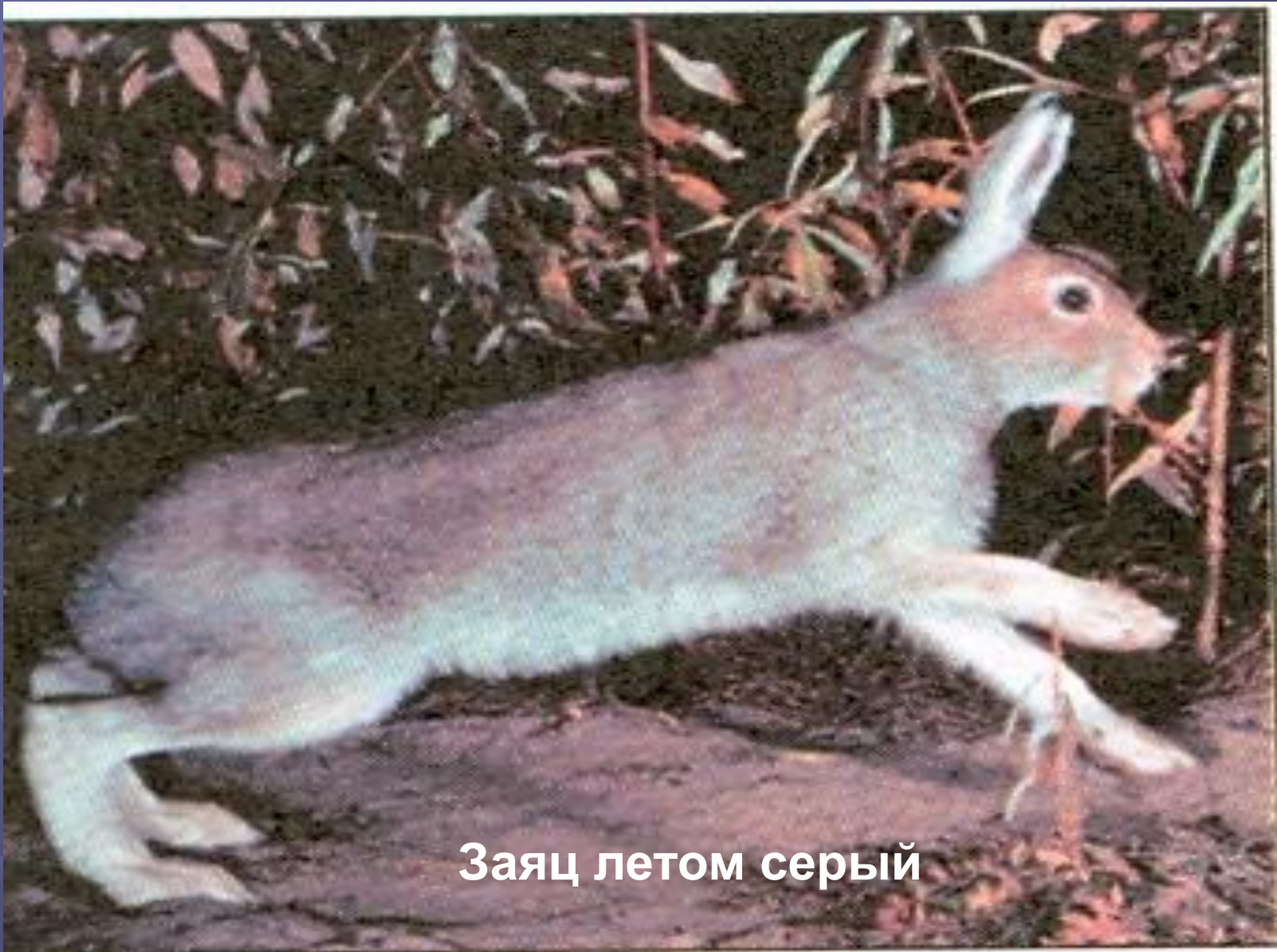
Заяц летом серый