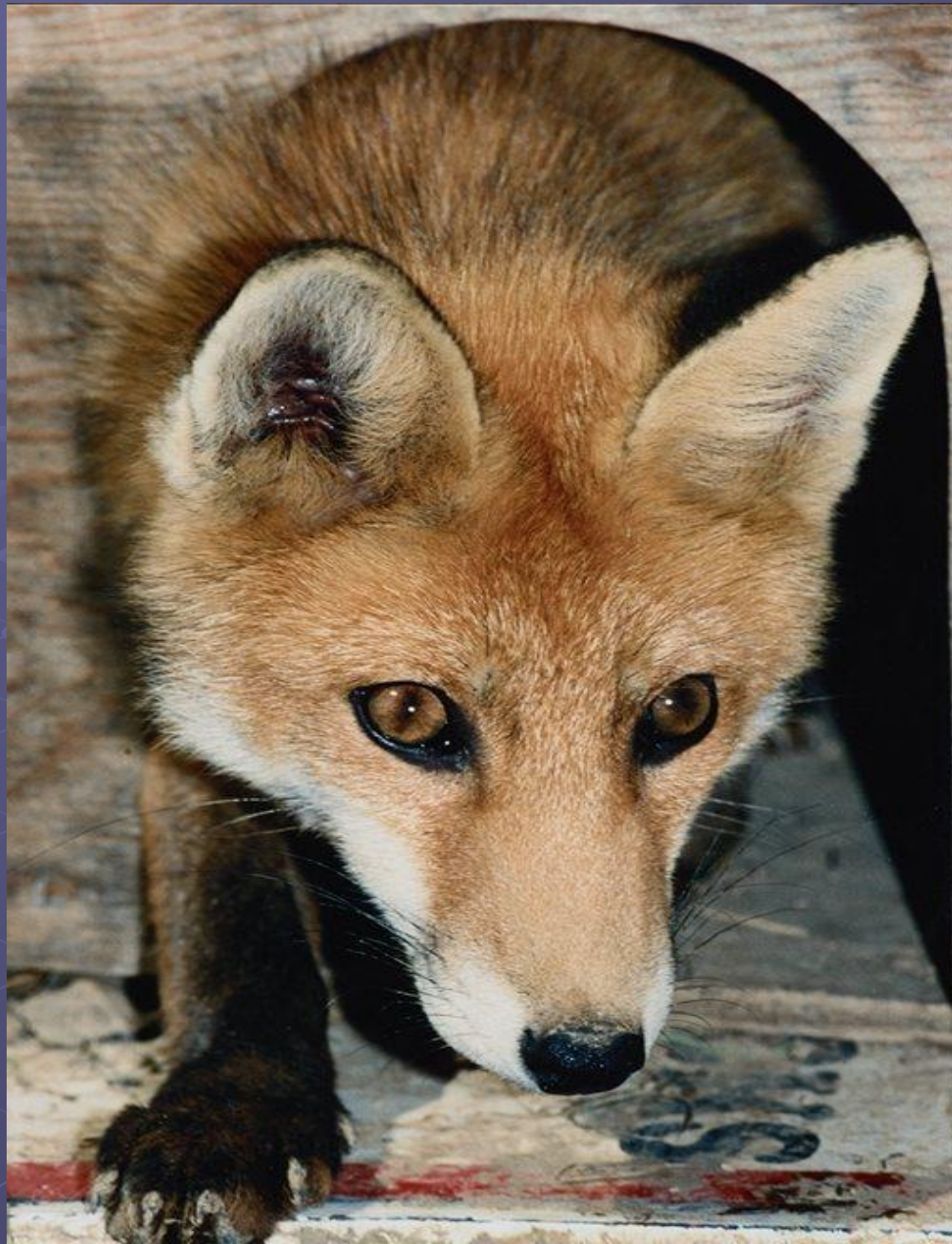
Лиса на охоте