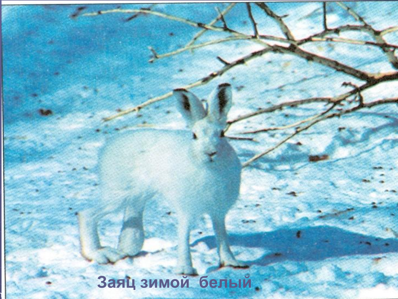
Заяц зимой белый