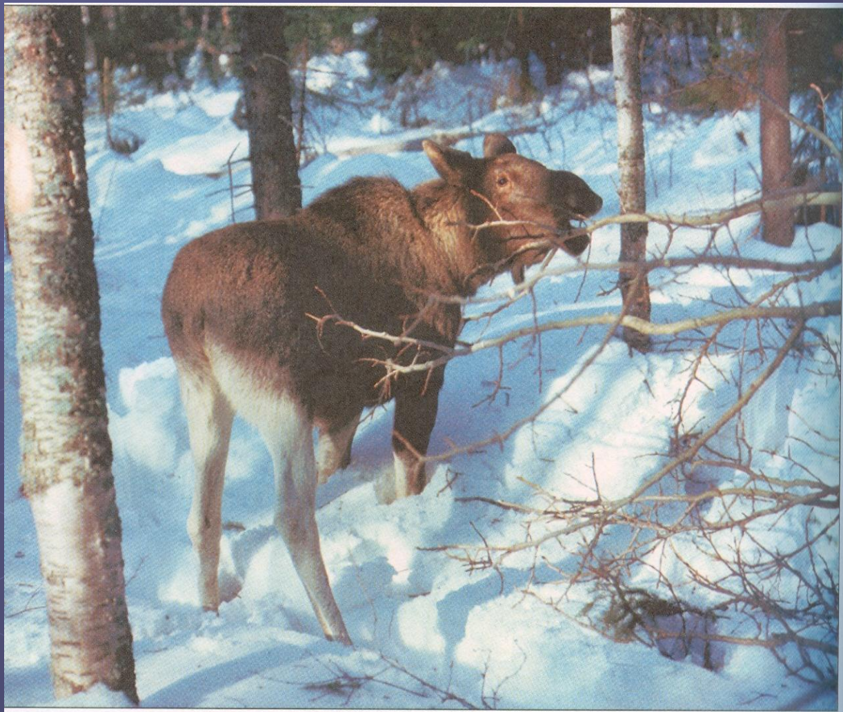
Лоси обгладывают осинки