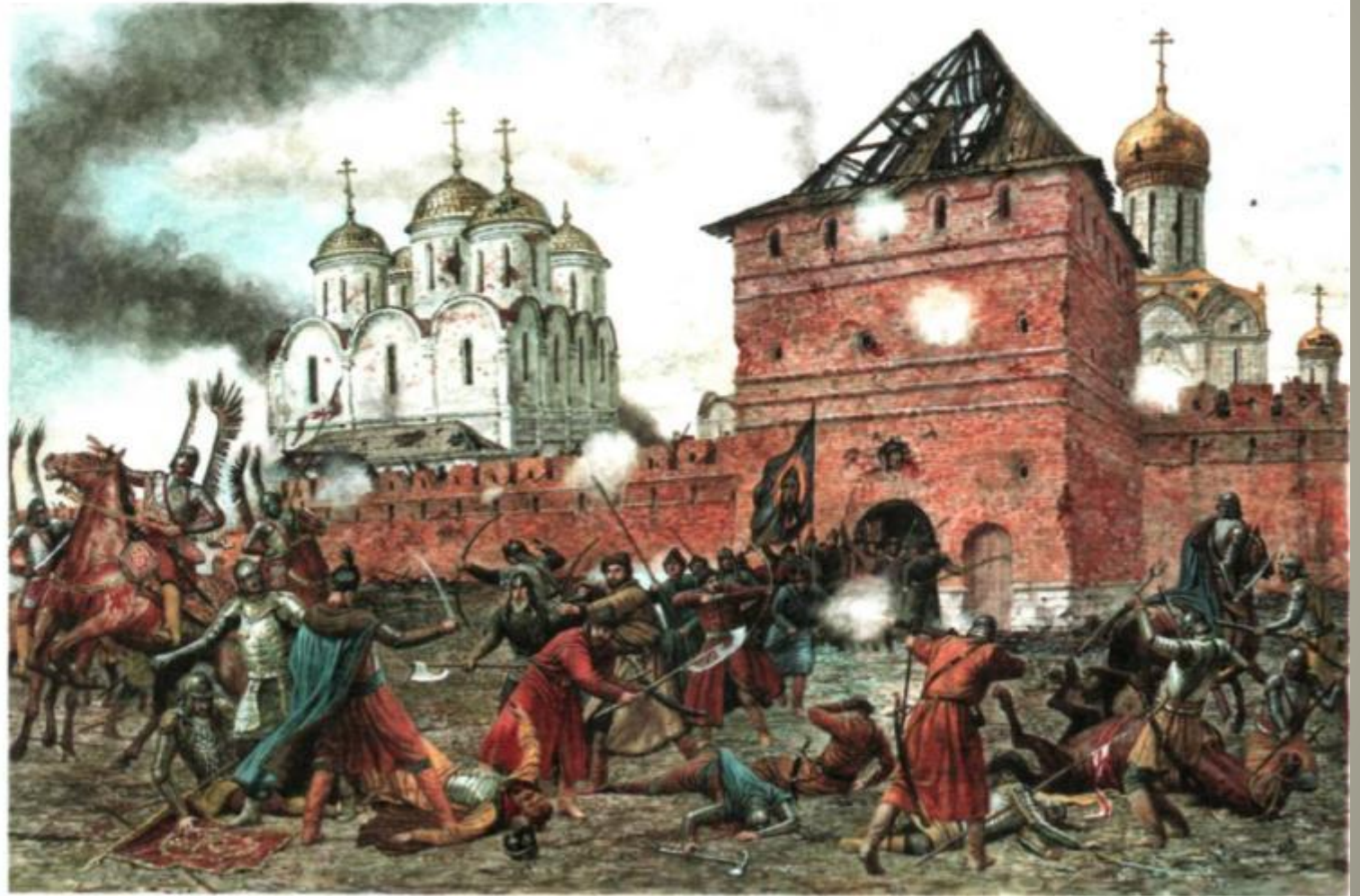
Оборона Троице-Сергиевой Лавры от польских интервентов