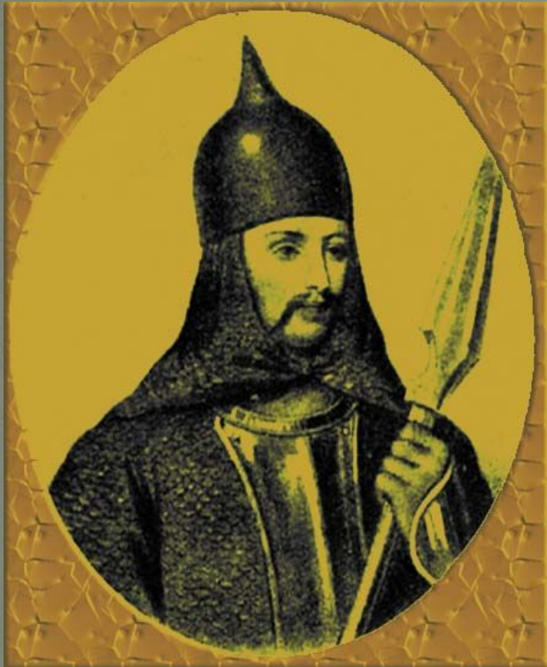
Князь Киевский (882-912). Вещий Олег - легендарный древнерусский воевода

Постепенно варяги-скандинавы сжились со славянами, легко переняли их язык и обычаи и остались жить в славянских городах. У Рюрика был сын Игорь, но по молодости лет он еще не мог стать правителем. Князем после смерти Рюрика стал Олег, который и осуществил объединение славянских земель в единое государство.