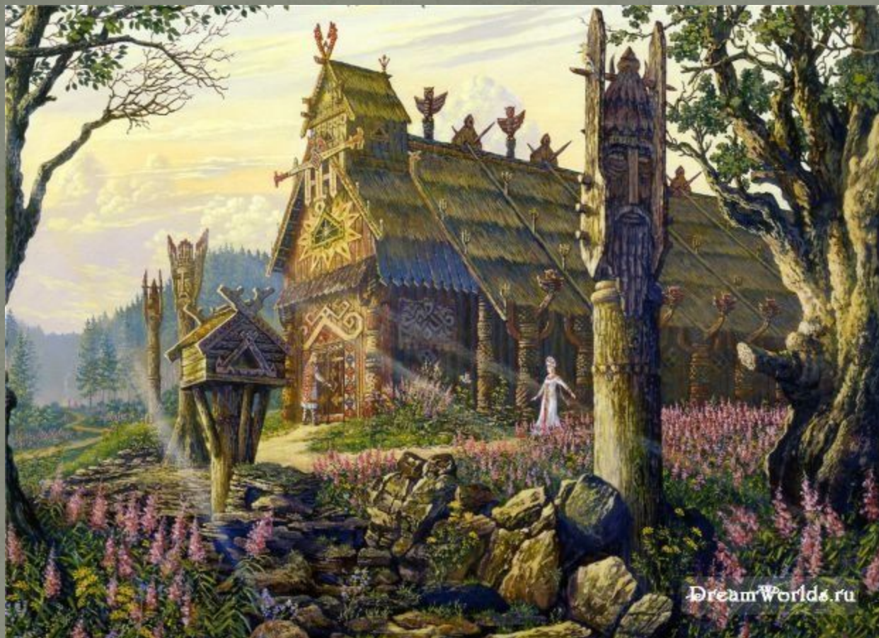
Храм Радогоща. Лето