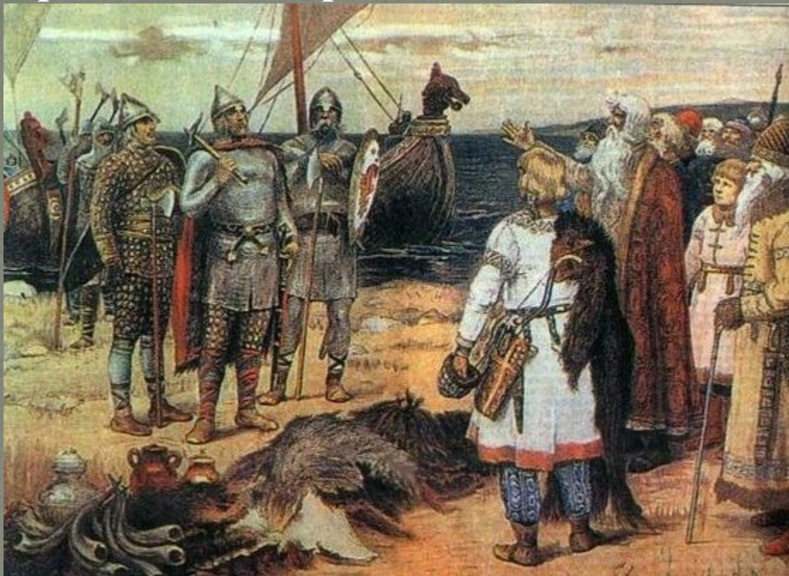
А.М. Васнецов «Варяги»

Варяги из заморья взи́мали дань с чуди, и со славян, и с мери, и со всех кривичей.