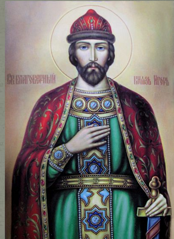
Игорь Рюрикович - великий князь Киевской Руси