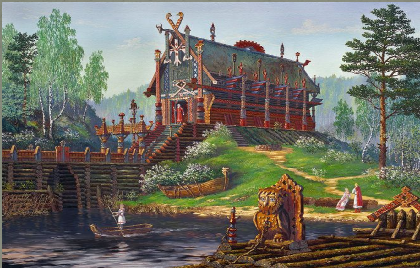
Храм Свентовида. Весна