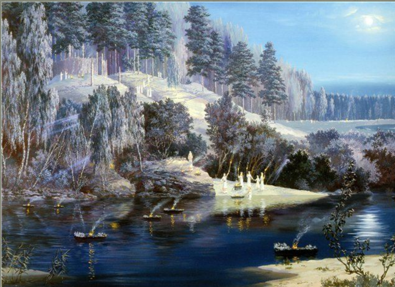
Ночь накануне праздника Купалы