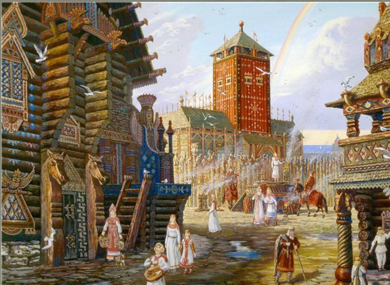
Радуга над Арконой