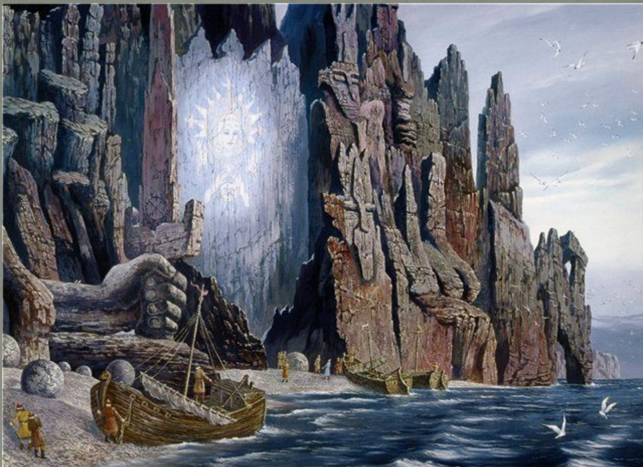
Видение поморам богини Гипербореи