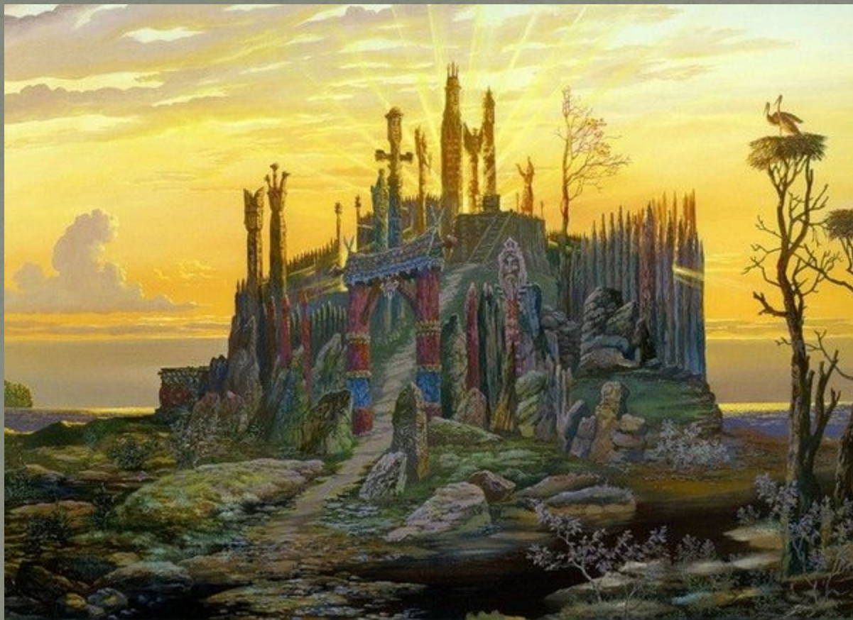
Капище у озера