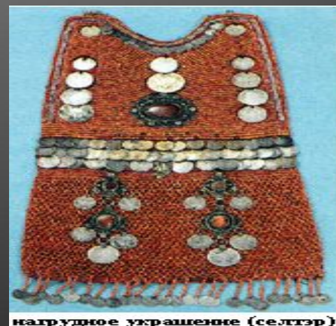
нагрудное украшение (селтер)