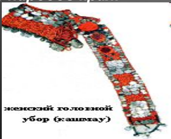
женский головной убор (каштгау)