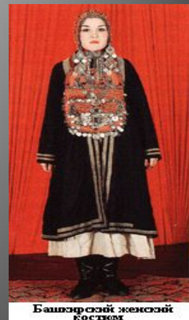
Башкирский женский костюм

Основу башкирского женского костюма составляет нательное платье (кулдэк) с оборками, украшенное тканым узором и вышивкой. Оборки, манжеты, защипы на груди появляются на платьях лишь в начале XX столетия. Отложной воротник обычно выполнялся из фабричной, более мягкой ткани (сатина, ситца), а нагрудный разрез скреплялся шнурком. Подол и рукава окаймляют красные полосы браного узора, а красный сатин воротника расшит счетной гладью. Туникообразный покрой одежды - самый распространенный в национальном костюме народов края.