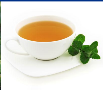
Веточка чайного дерева