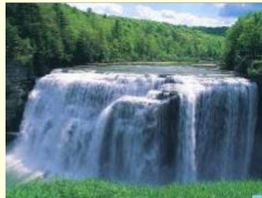
Водопады в холмистой местности