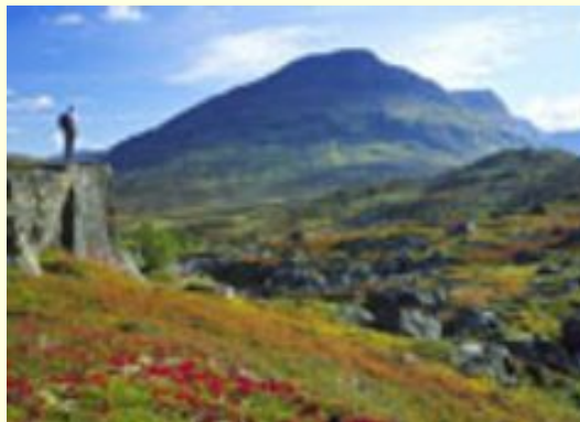
Реки и горы Швеции