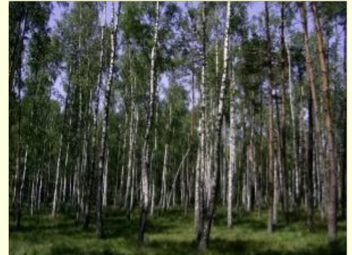
Леса на равнинах