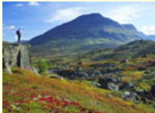
Реки и горы Швеции