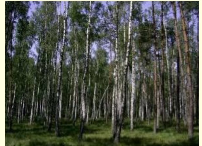
Леса на равнинах