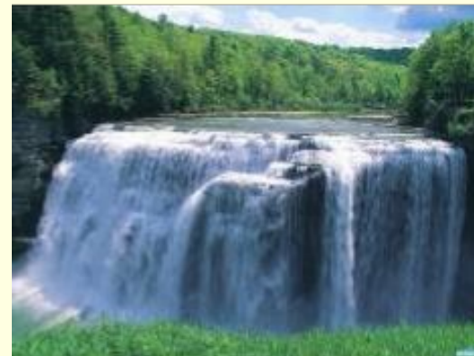
Водопады в холмистой местности