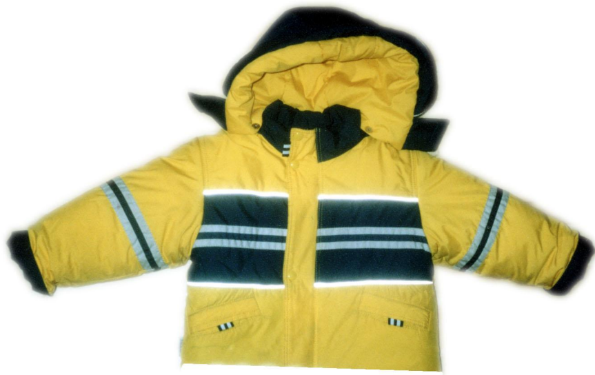
КУРТКА НА МЕХУ ИЛИ ПУХОВИК