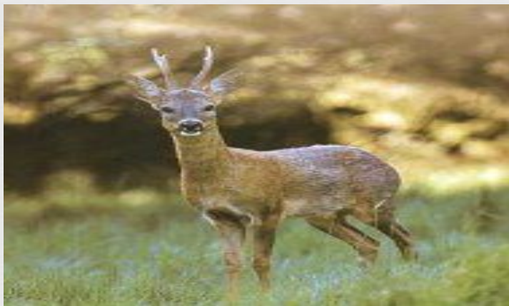
□ Косуля-80 км/ч