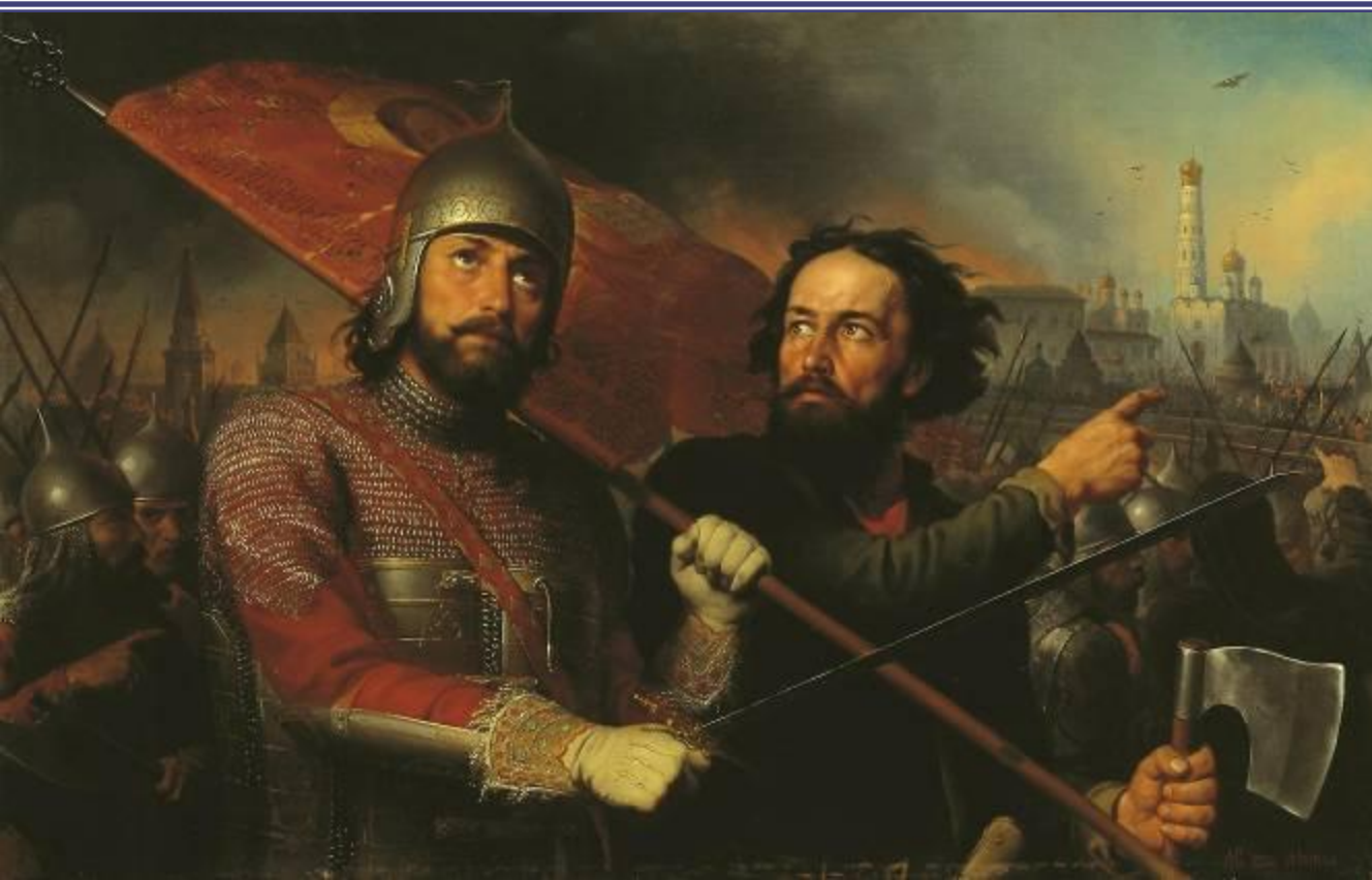
ЧАСОВНЯ на месте сбора ополчения Минина и Пожарского (Нижний Новгород)