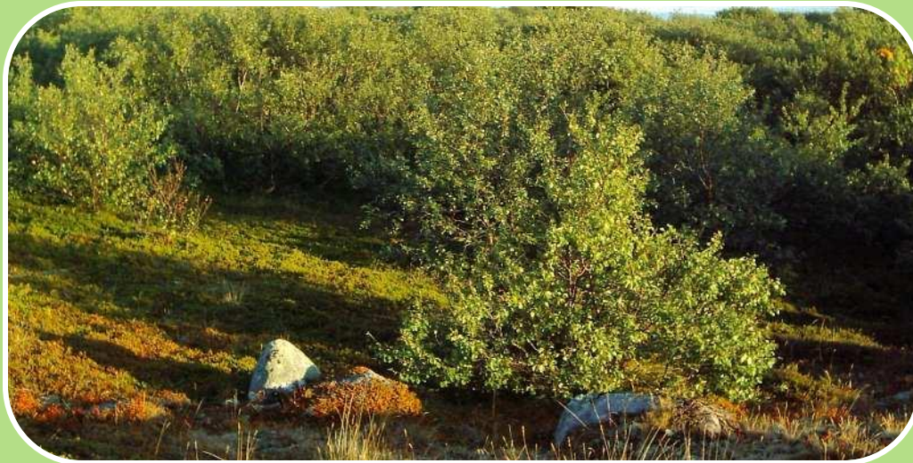
Так выглядит лес в тундре