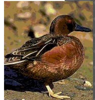
Американская чёрная кряква