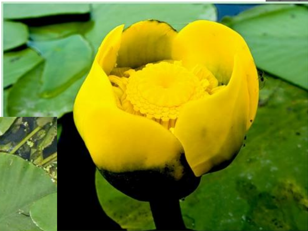
Кубышка (жёлтая кувшинка)