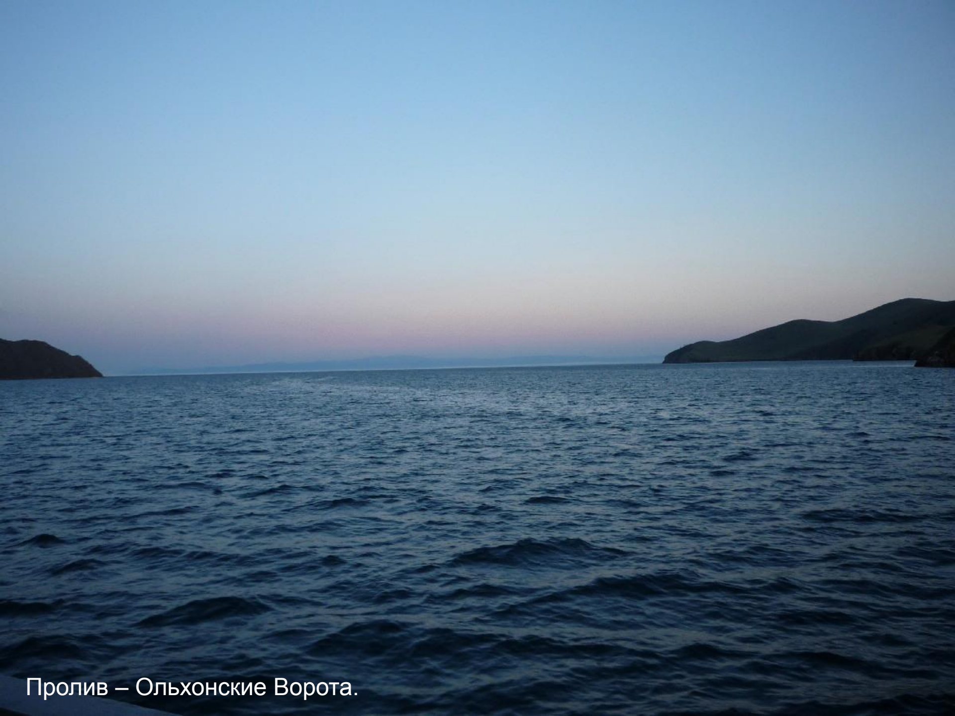
Пролив – Ольхонские Ворота.