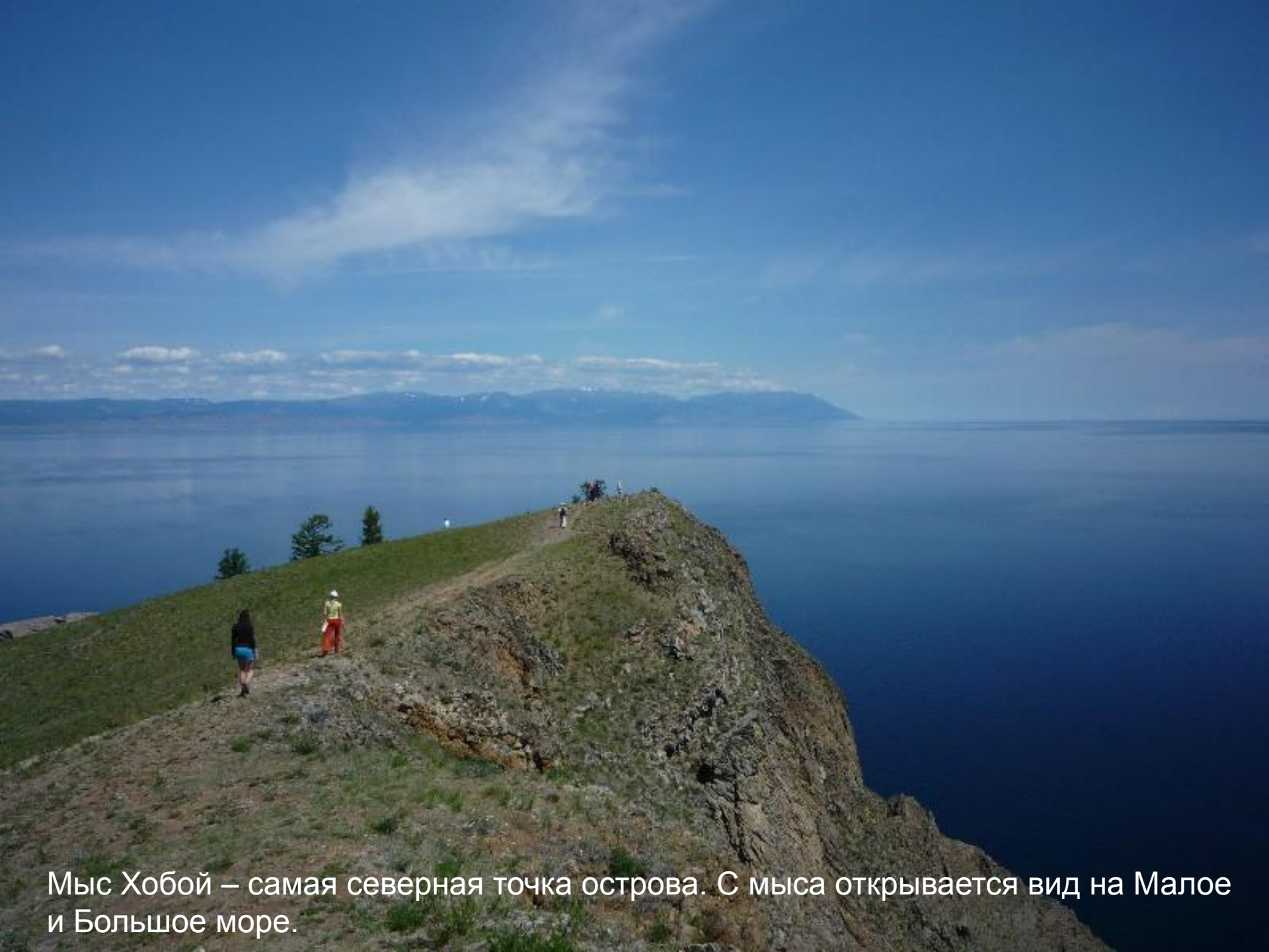
Мыс Хобой – самая северная точка острова. С мыса открывается вид на Малое и Большое море.