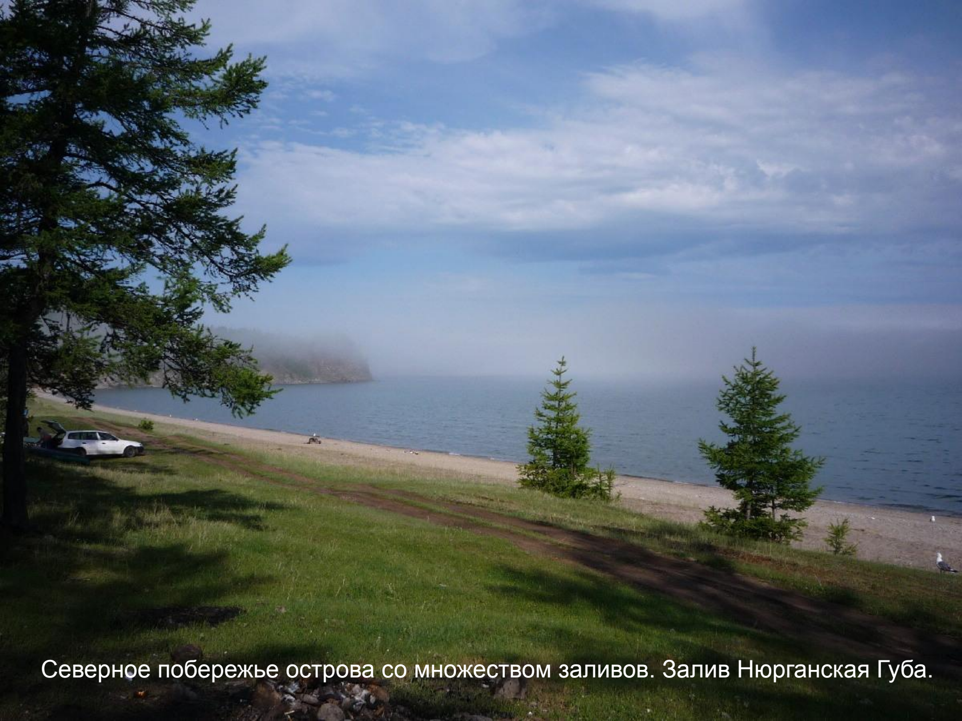
Северное побережье острова со множеством заливов. Залив Нюрганская Губа.