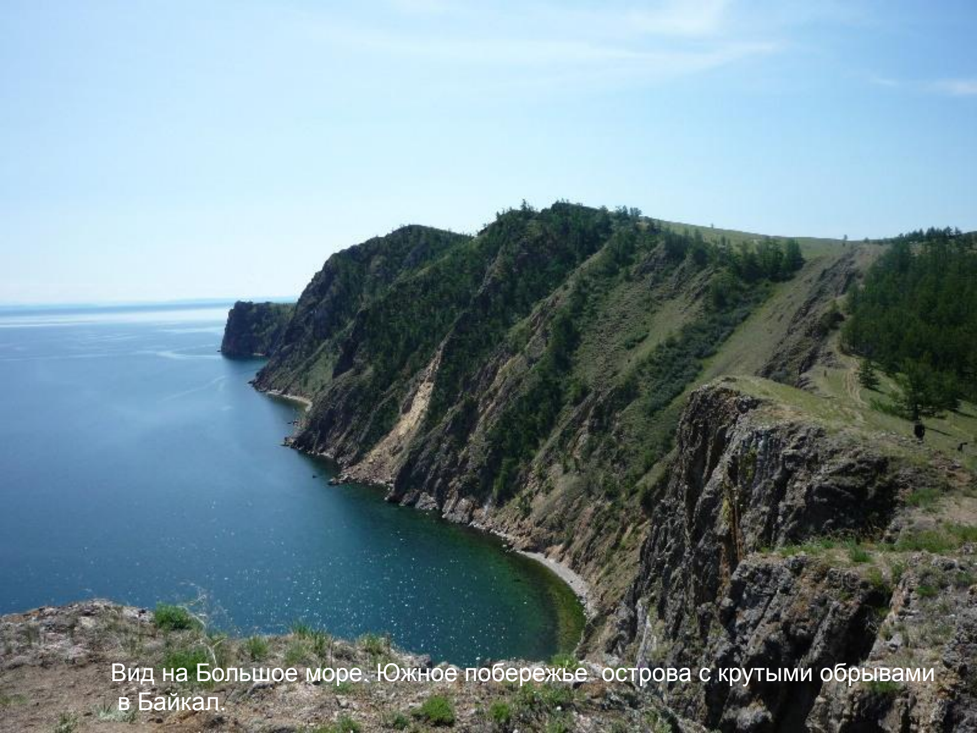
Вид на Большое море. Южное побережье острова с крутыми обрывами в Байкал.