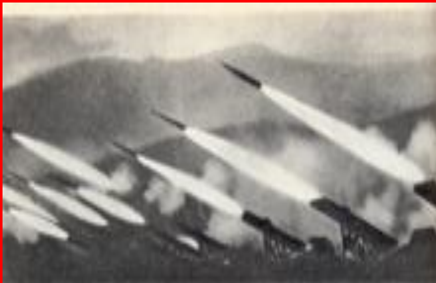
Начало контрнаступления под Сталинградом. Ноябрь 1942 г.