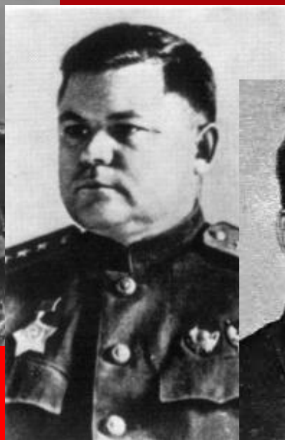
Николай Фёдорович Ватутин