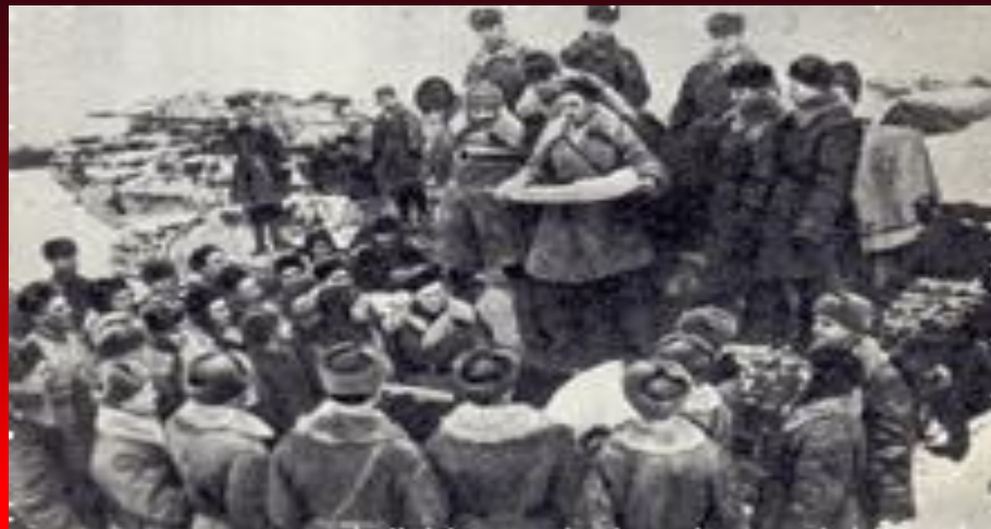
Перед выступлением. Средний Дон, декабрь 1942 г.