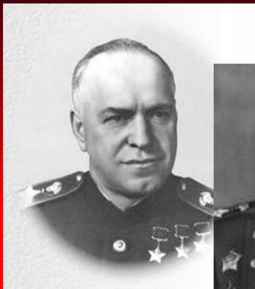
Георгий Константинович Жуков