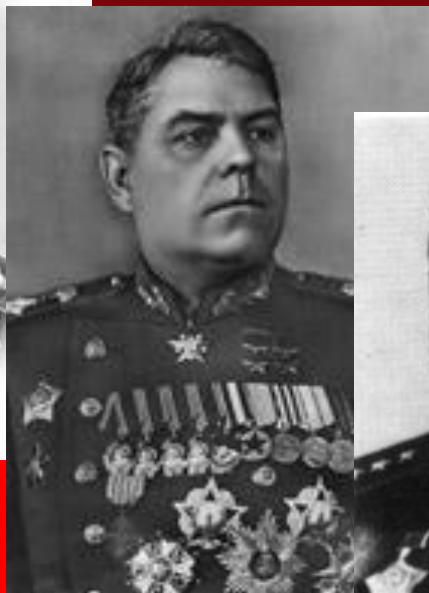
Александр Михайлович Василевский