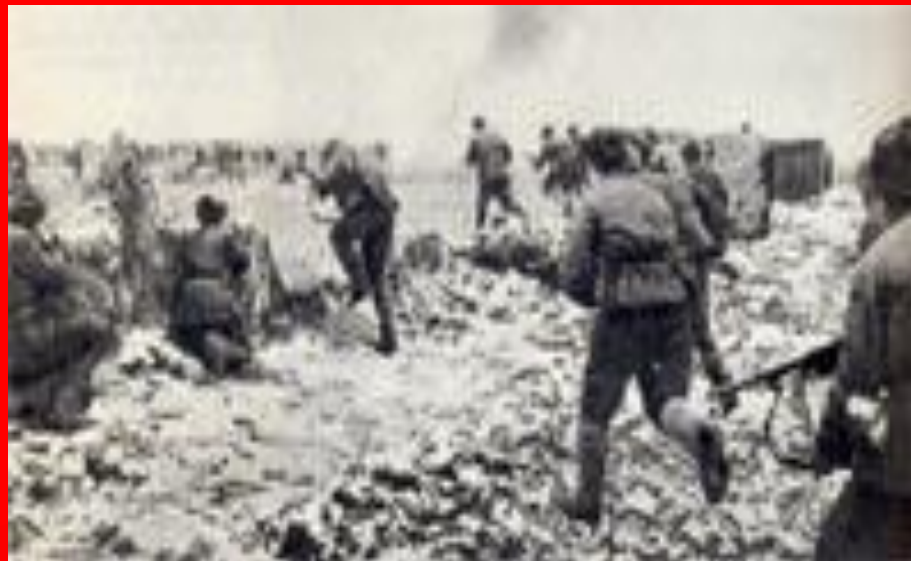
Атакуют стрелковые части. 1942 г.