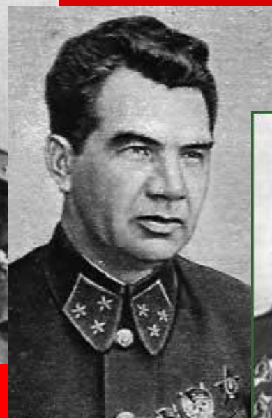
Василий Иванович Чуйков