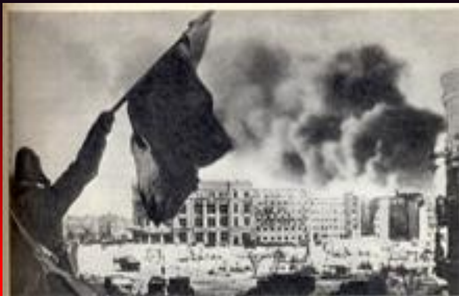
Сталинград. Февраль 1943 г.

«Великих битв мы знаем строки, Имён героев нам не счесть. Легенды - вы из той эпохи Гордиться вами – наша честь!» (Василий Панов)