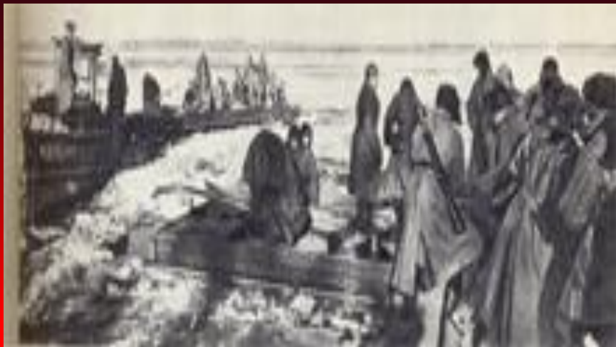
Переправа на Волге. Выгрузка боеприпасов, ноябрь 1942 г.