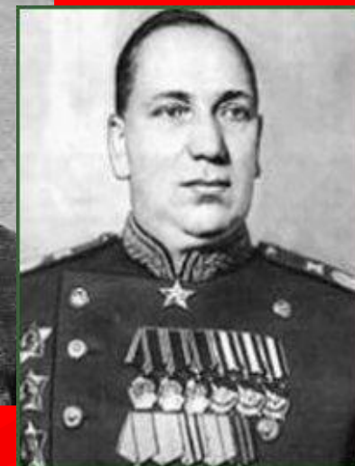
Николай Николаевич Воронов