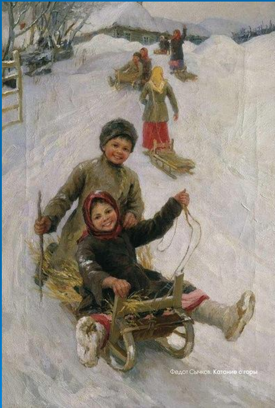
Федот Сычков. Катание с горы