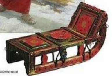
Санки для катания