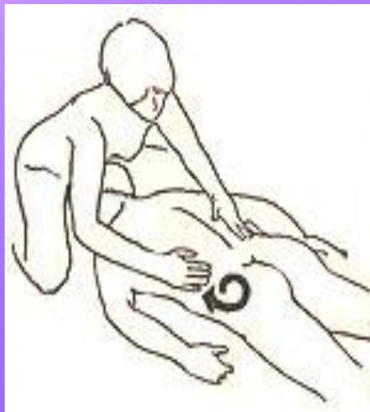
Широкие круговые движения