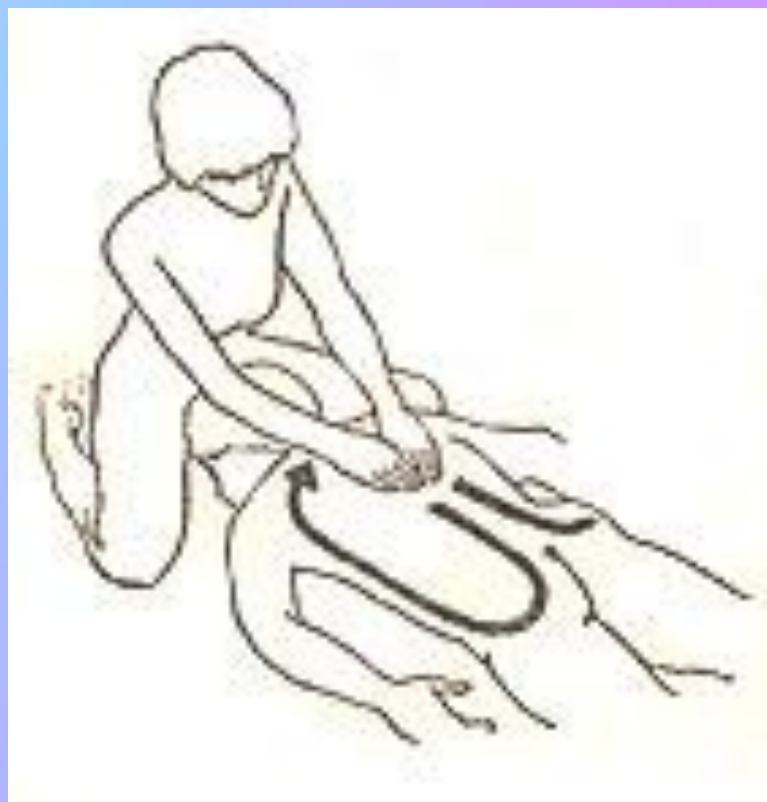
Длинные круговые движения