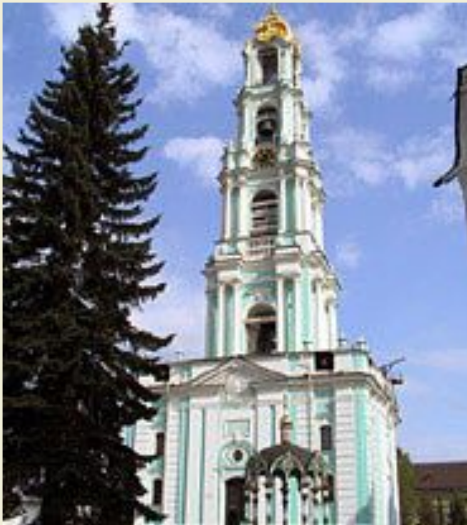
Троице-Сергиева лавра – монастырь (14 век)