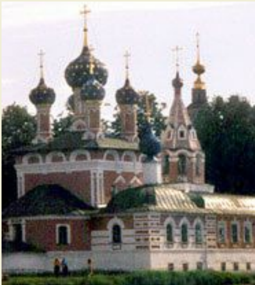
Церковь Дмитрия «на крови»