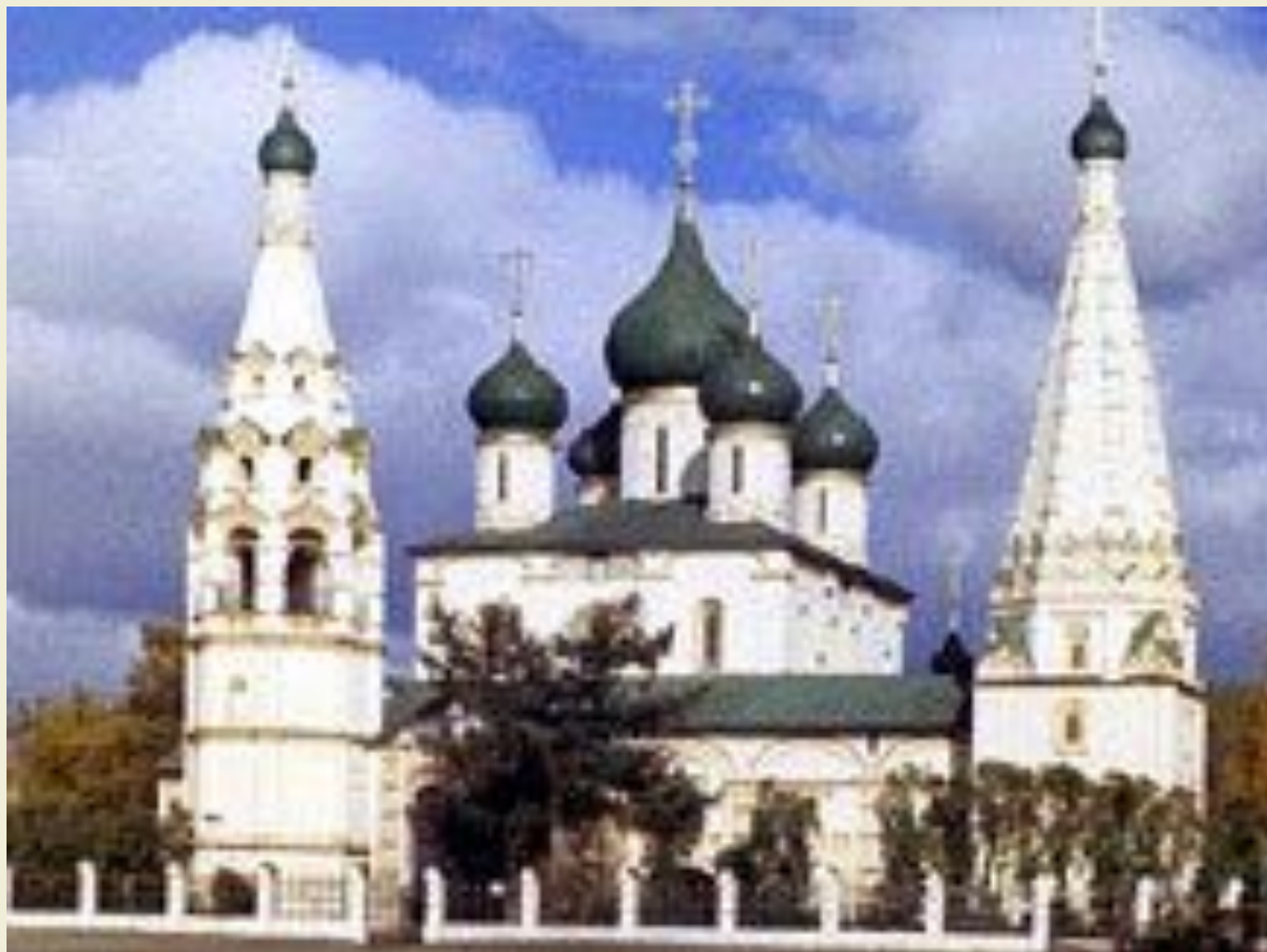
Церковь Ильи Пророка