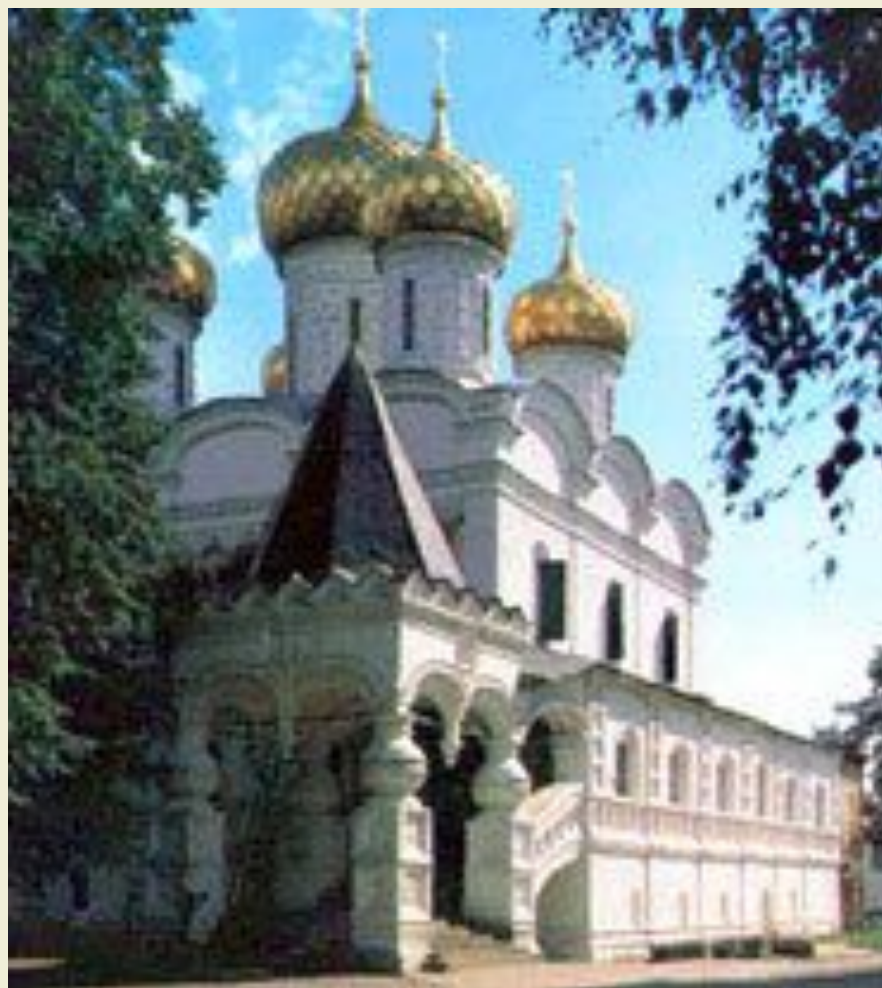
Троицкий собор в Ипатьевском монастыре (13 век)