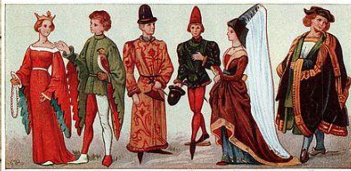
DRESS OF ANCIENT PERIOD (SEE DESCRIPTION FOLLOWING)