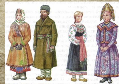
Одежда русских крестьян