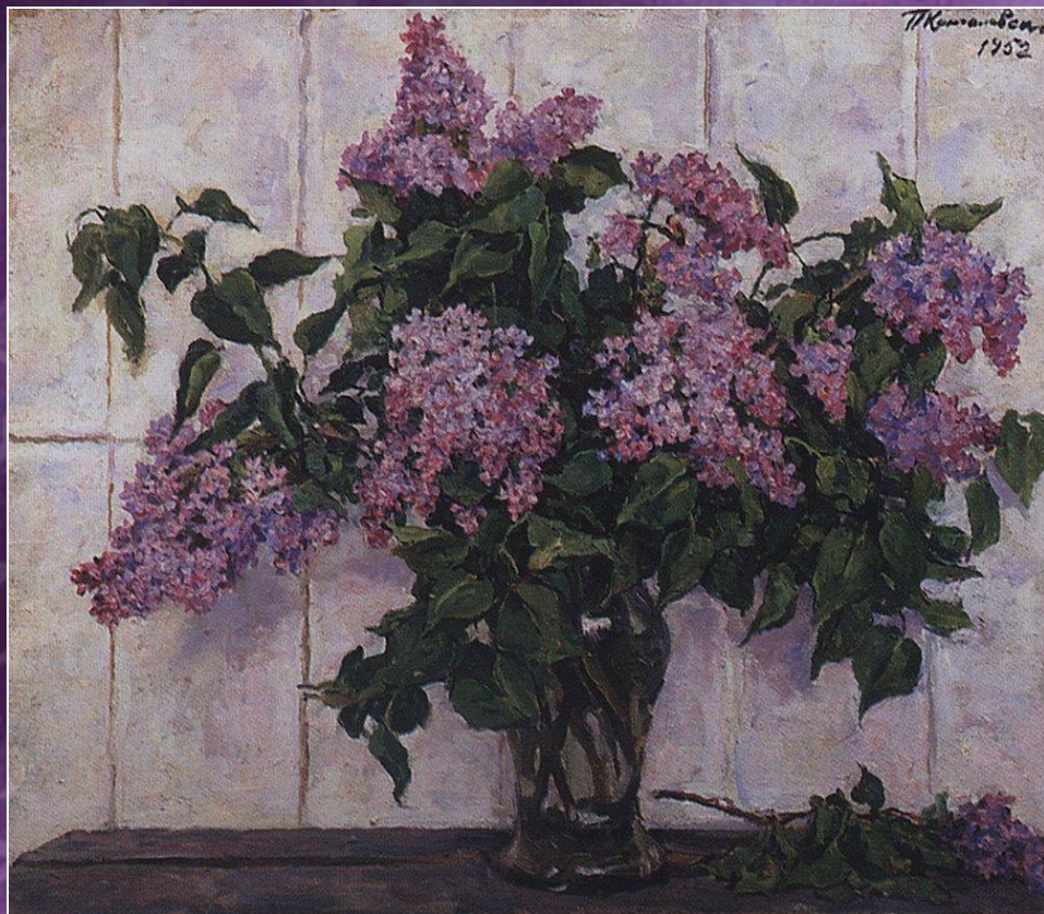
Сирень в стеклянной банке 1952