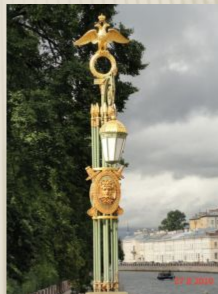
Мост Ломоносова Старо-Калинкин Пантелеймоновский