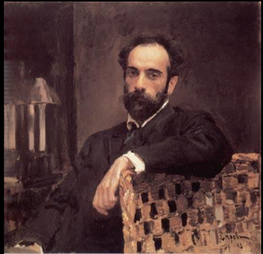
Портрет- то получился