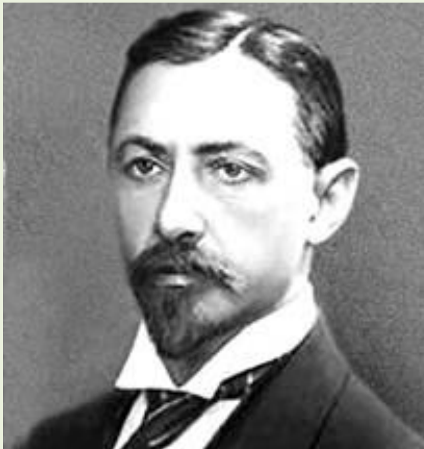
Бунин Иван Андреевич