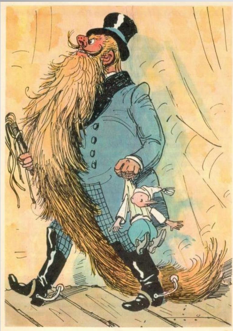
Карабас - Барабас