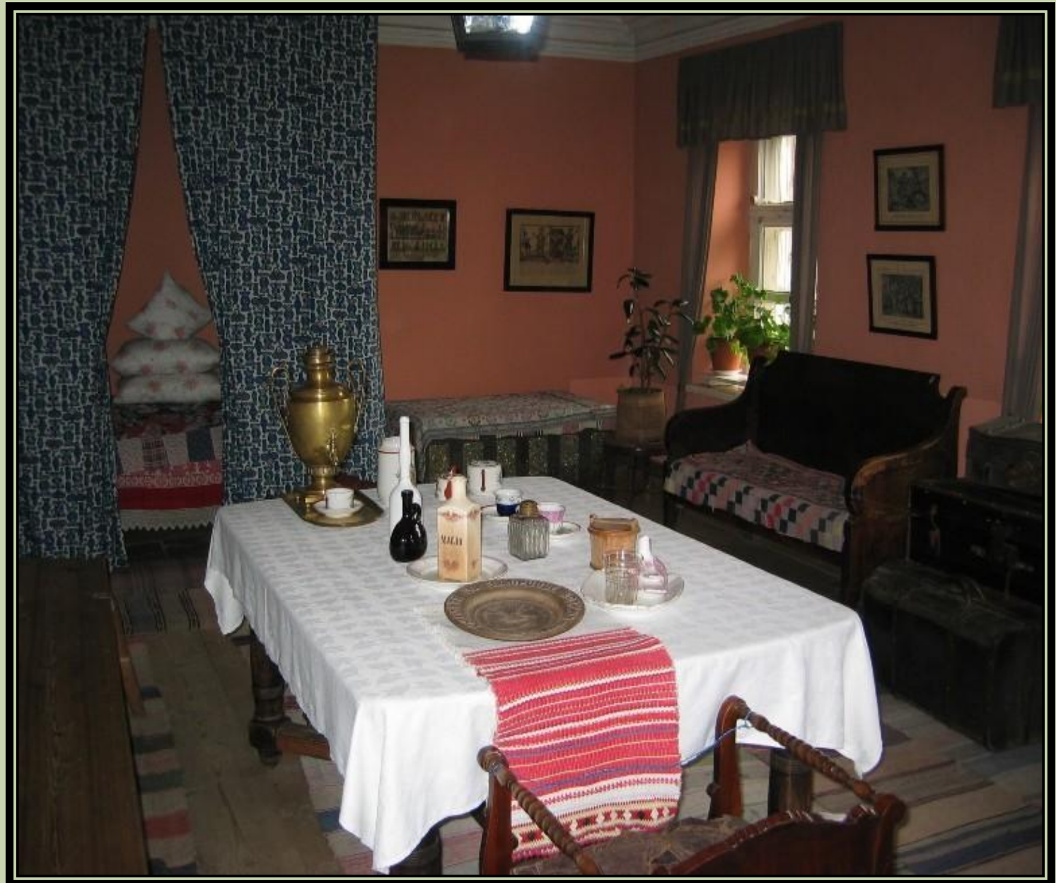
А.С.Пушкин «Станционный смотритель»

Обитель – 1. монастырь. 2. поэтич. место пребывания, жилище. (9)