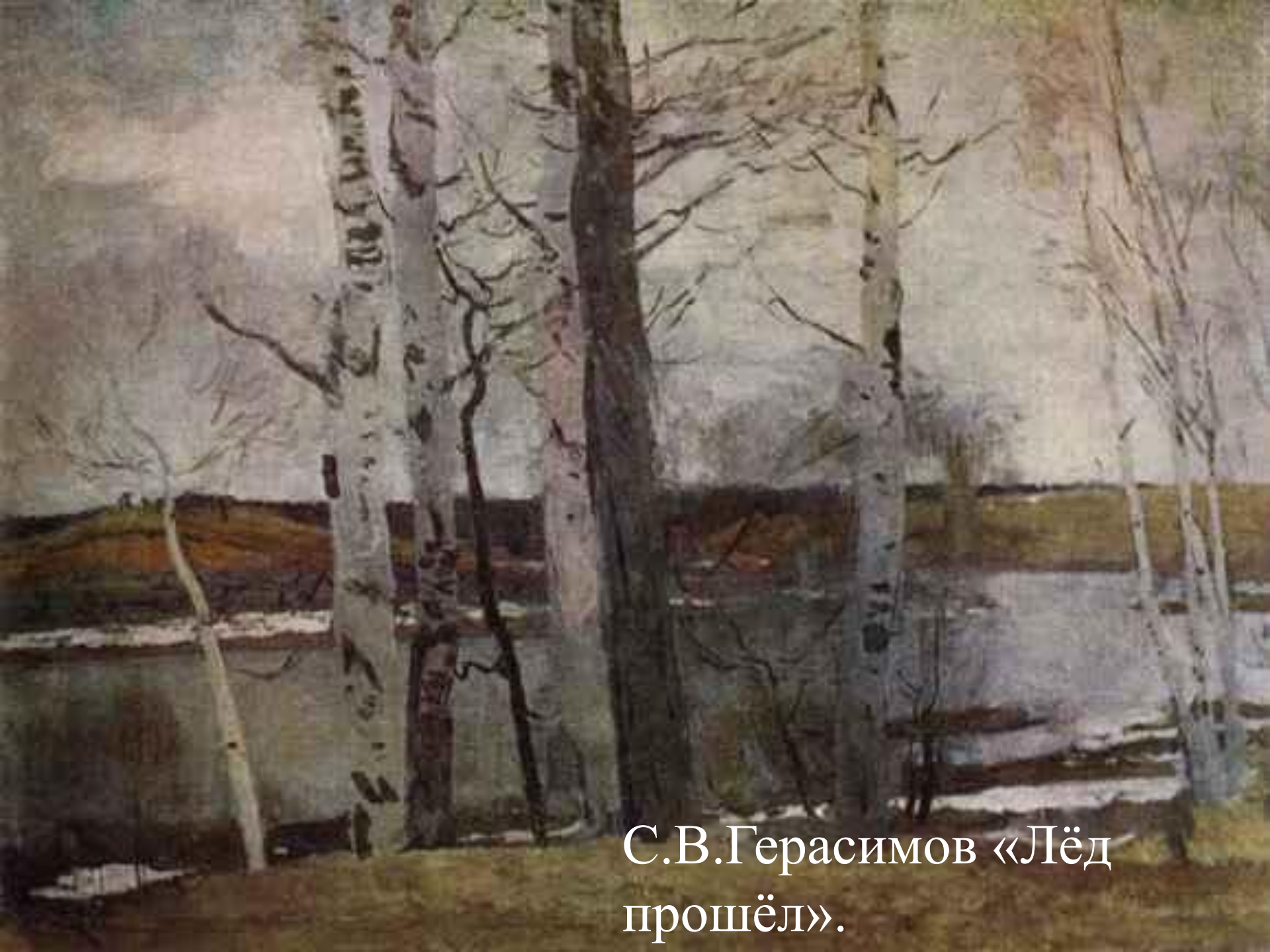
С.В.Герасимов «Лёд прошёл».