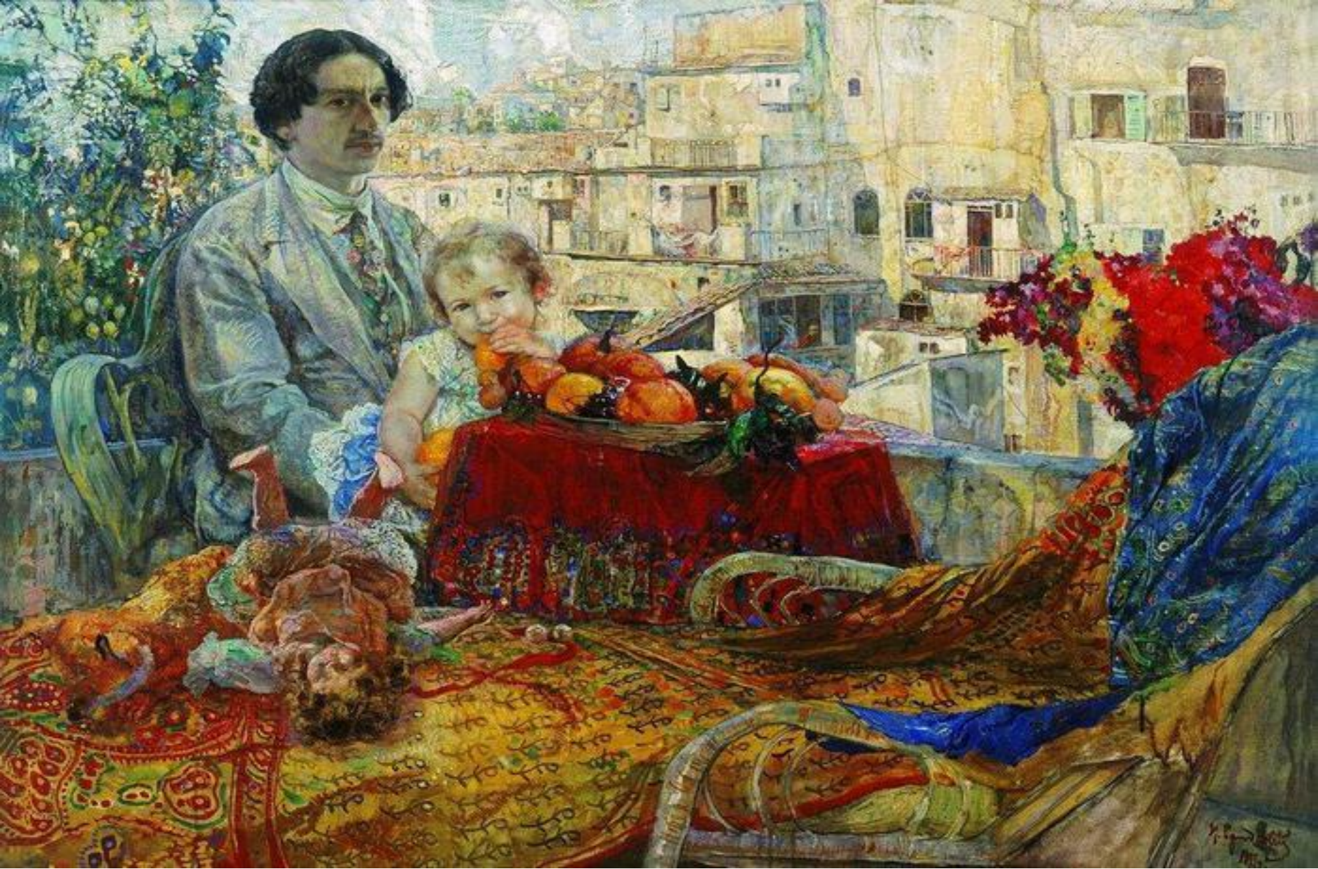
«Автопортрет с дочерью»